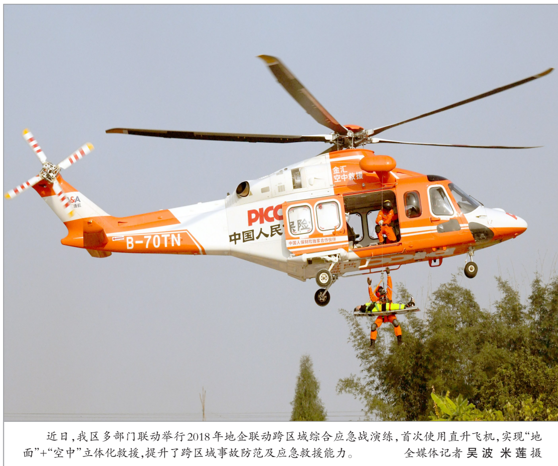
近日,我区多部门联合举行2018年地企联动跨区域综合应急演练,首次使用直升飞机,实现“地面”+“空中”立体化救援,提升了跨区域事故防范及应急救援能力。