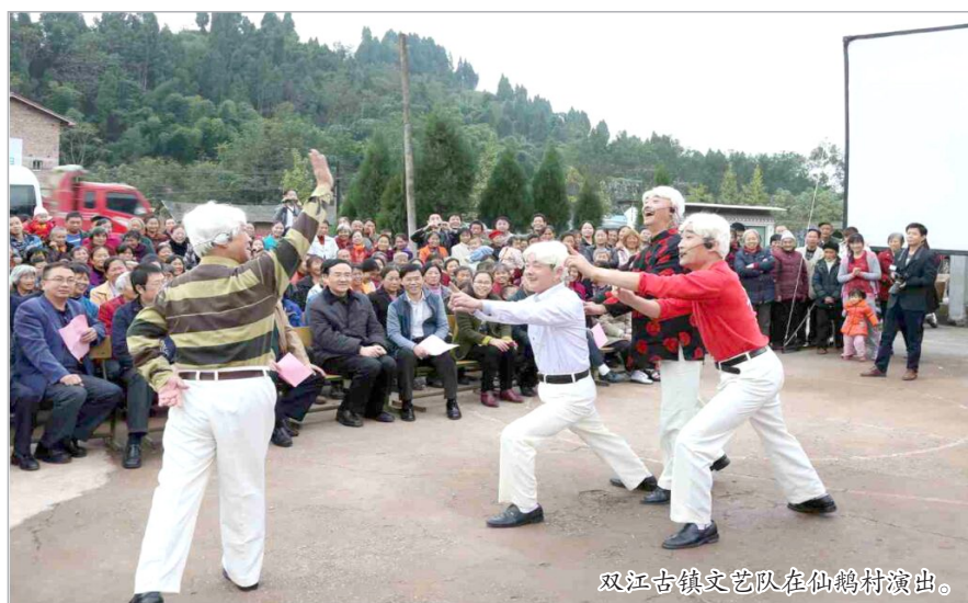
双江古镇文艺队在仙鹤村演出。

可持续、受欢迎的现代公共文化服务体系,以更好地满足人民群众的精神文化需求。自2014年7月以来,潼南区在全市率先启动政府购买村级公共文化演出服务试点工作,每年为全区281个行政村各购买4场文艺演出,每季度1场,将文艺演出免费送到群众的田间地头,实现“零距离”服务。