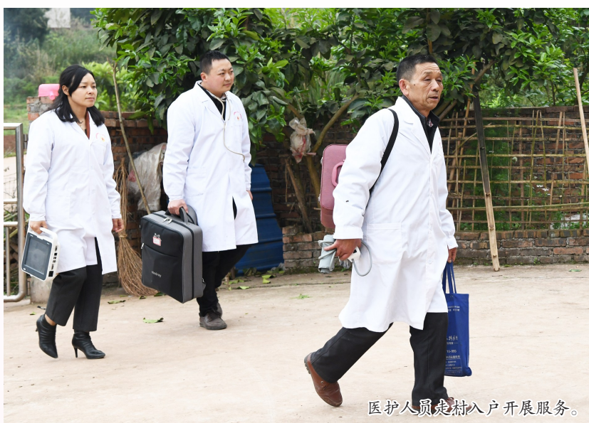
医护人员入户开展服务。