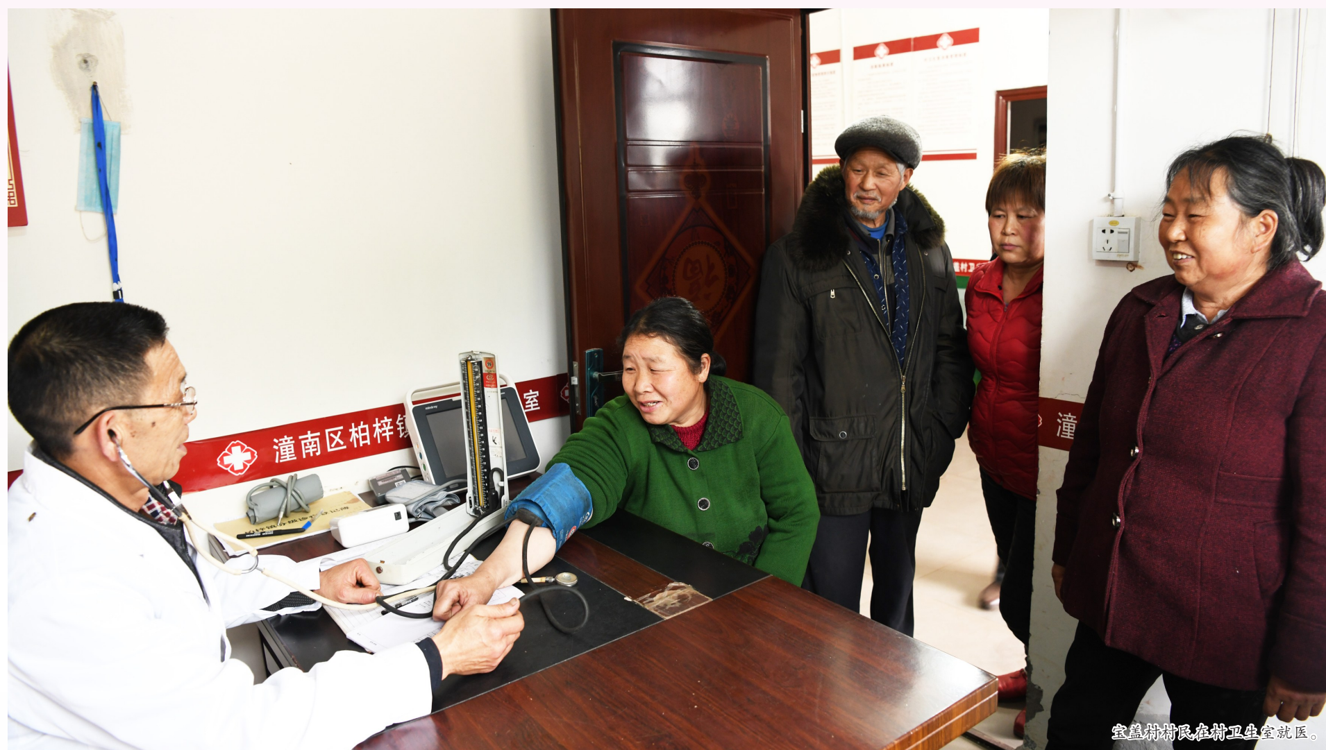
宝盖村居民在社区卫生室就医。