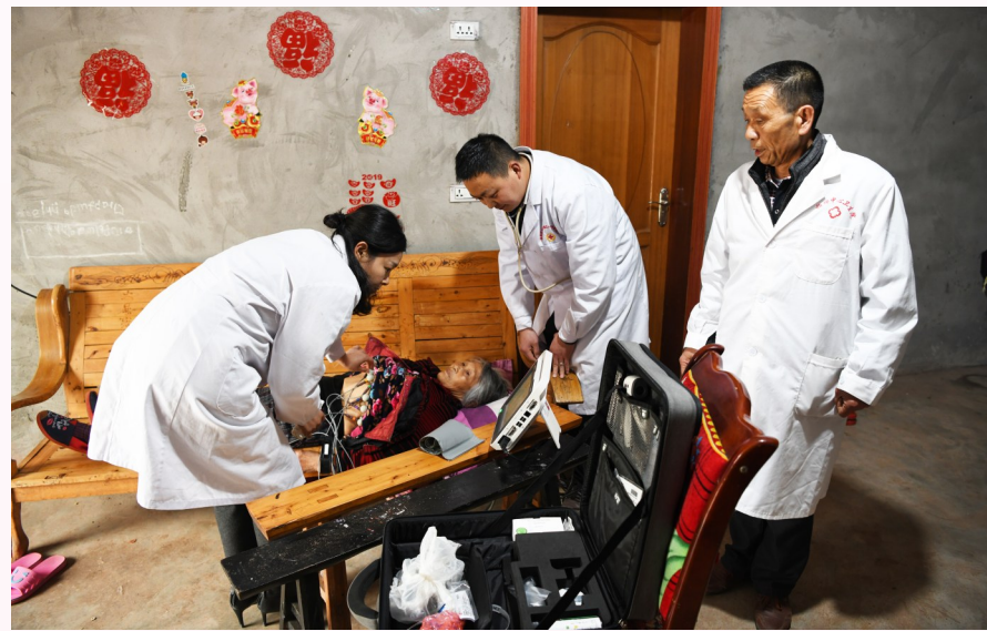
群众在家享受医疗服务。

“我们的村医现在是在白天做服务、晚上做资料，专业能力有大幅提升的同时，其他综合能力也得到了提升。”周文才说，目前，柏梓分院村医的公共卫生服务专业知识比个别中心卫生院医生还强。“前不久，村医代表我院参加全市的公共卫生服务能力测试，取得了非常优异的成绩，在全市都名列前茅。”周文才高兴地说。