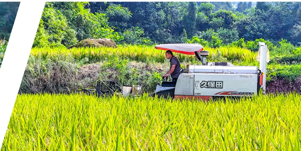
2025 年 8 月 12 日，周毅红给村民颜台贵收割稻谷。