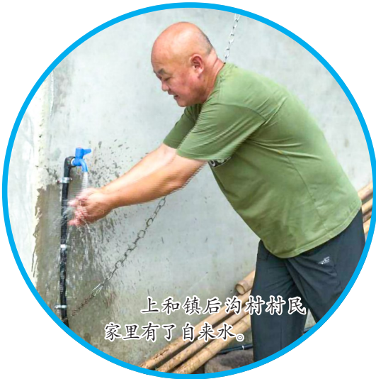
上和镇后沟村村民家里有了自来水。