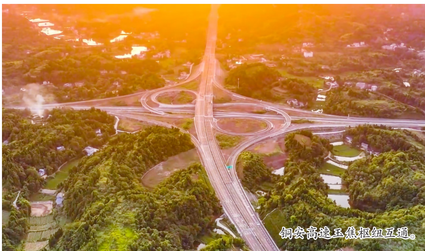
铜安高速玉皇枢纽互通。

铁路方面，渝遂快速铁路（含复线）57.3公里线路平稳运行，设计时速200公里/小时，火车站客运站房及货运站场升级改造正式启动，预计2026年1月投用后，将进一步强化潼南在区域交通中的枢纽地位，助力全面融入成渝地区双城“1小时经济圈”。