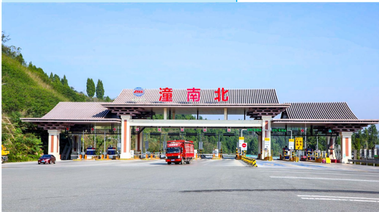
合安高速潼南北收费站。