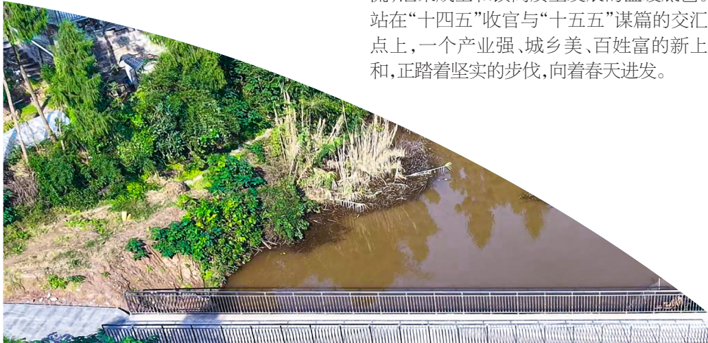
改造后的上和镇赵家溪石河堰。