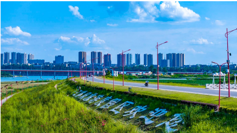
平坦美丽的滨江路。