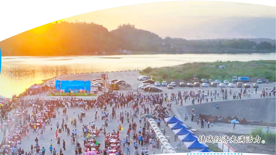
镇域经济充满活力。