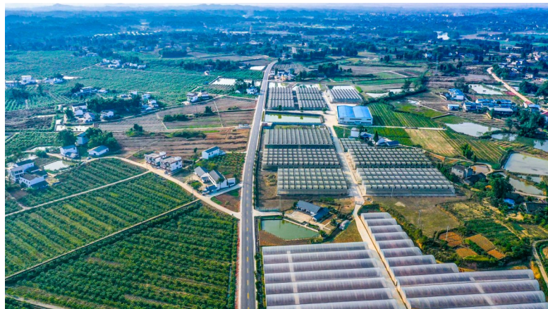
柏梓镇郭坡村农村公路。