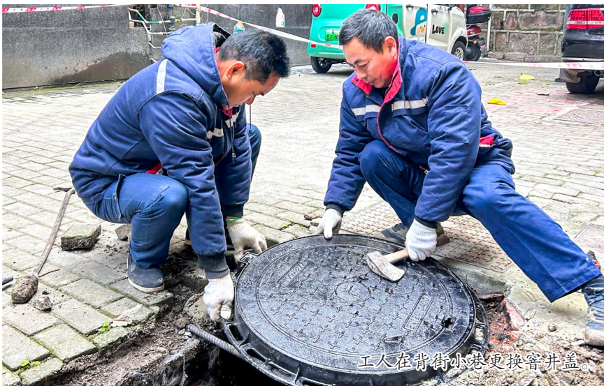
工人在背街小巷更换窨井盖