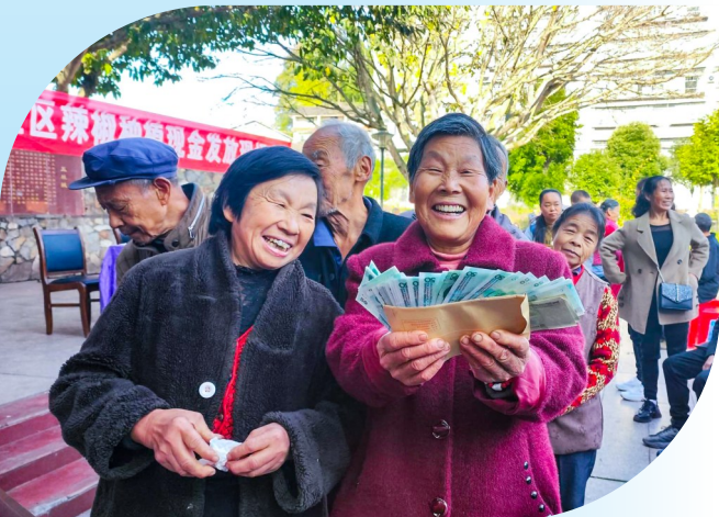
分到红利的村民喜笑颜开。

发展集体经济,关键在于找准适合本地的产业。五桂镇摒弃“一刀切”思维,深入挖掘各村资源禀赋,引导其走出各具特色的产业发展之路,形成了“一村一品”或“一村多品”的生动格局。