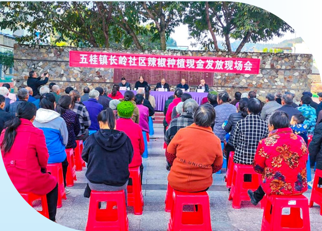
五桂镇集体经济分红。