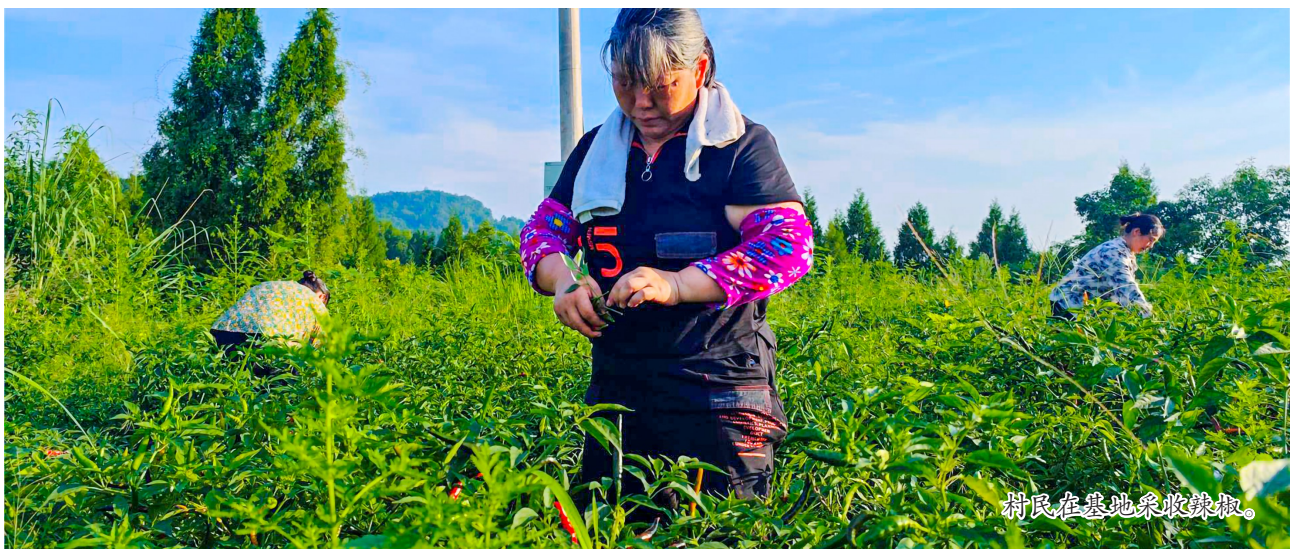
村民在基地采收辣椒。

从探索起步的“点上开花”,到如今机制成熟、效益初显的“面上结果”,五桂镇通过激活集体经济这一“源头活水”,不仅盘活了沉睡的资源,更唤醒了乡村内在的发展动能。这片土地上,产业因集体而兴,集体因产业而强,村民因集体而富,一幅产业兴旺、生态宜居、生活富裕的乡村振兴新图景正变得越来越清晰、越来越生动。