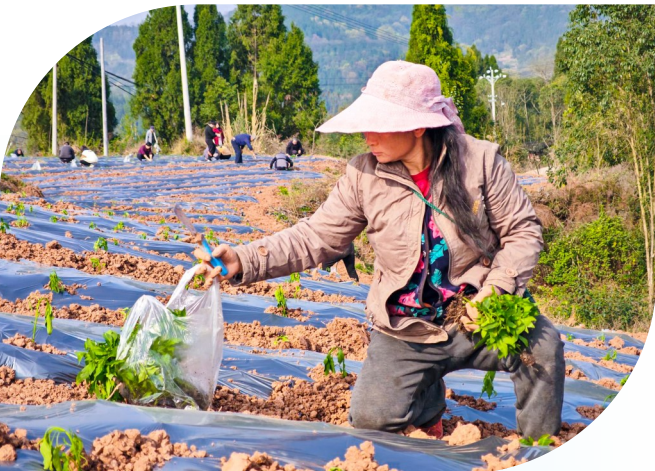
村民在蔬菜基地务工。

从长岭社区辣椒基地里红绿交错的丰收景象,到高碑村楠木柑橘园中压弯枝头的“黄金果”,再到东南村农户庭院里啄食的五黑鸡苗……如今这些充满生机的画面,共同构成了五桂镇探索多元化路径、发展壮大村级集体经济的生动实践。“十四五”以来,该镇坚持党建引领、因地制宜、创新模式,推动集体经济从无到有、由弱变强,不仅有效破解了乡村产业空心化、资源闲置化难题,更开辟出一条强村富民、振兴乡村的可持续发展之路。