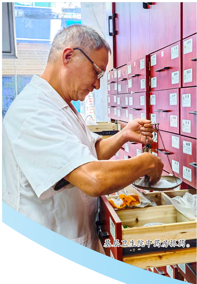
基层卫生院中药房抓药。