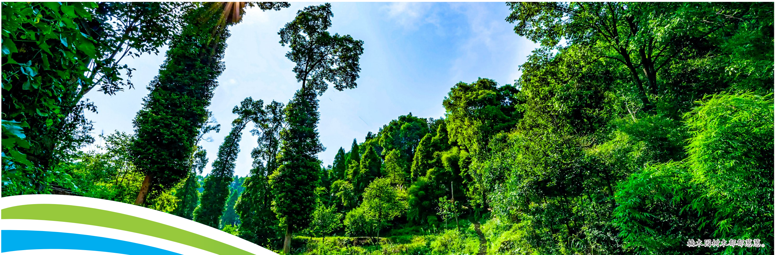
楠木园树木郁郁葱葱。