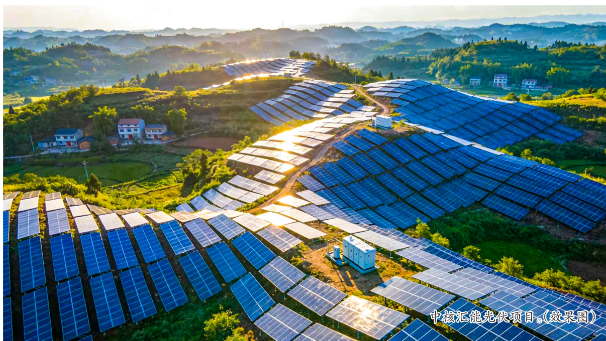
中核汇能光伏项目。(效果图)

本报讯(记者 陈俊霖 徐利)近日,中核汇能潼南小渡南10万千瓦光伏发电项目开工仪式在小渡镇月山村举行。标志着我区在推动清洁能源产业发展、服务国家“双碳”战略方面取得又一重要进展。