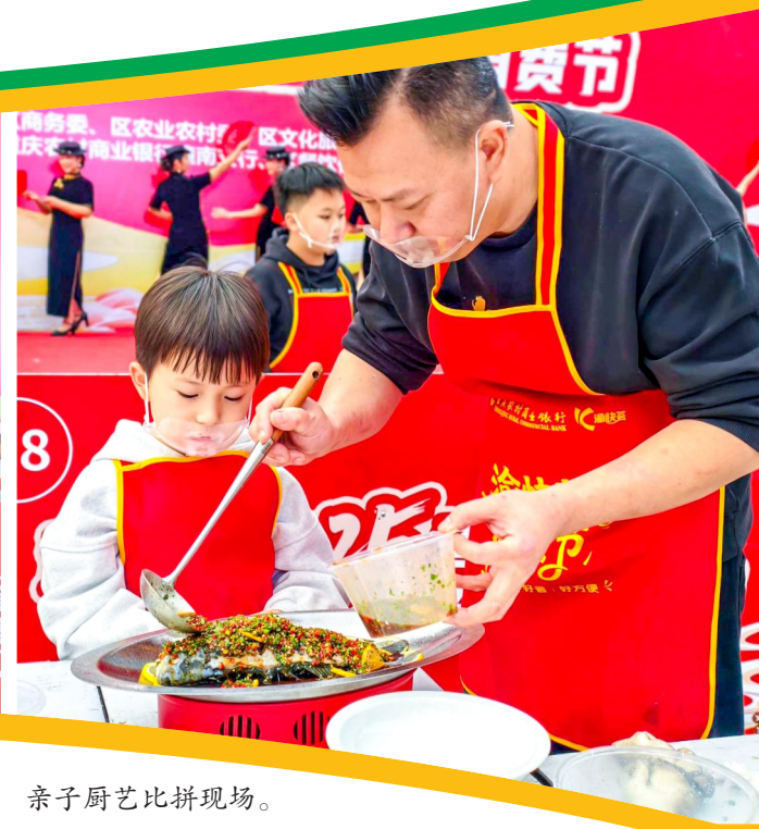
亲子厨艺比拼现场。