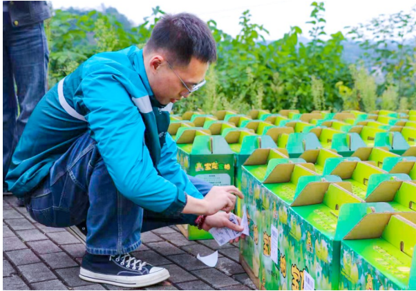
销售员为农产品贴订单标签。