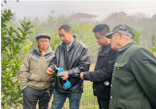
现场讲解柚子树病虫害防治知识。

在深耕传统优势产业的同时，宝龙镇依托资源禀赋多点布局，不断拓宽特色农业发展路径：创新“共享经济”模式，“龙湾共享稻米”实现产销精准对接；盘活镇域北部闲置土地，打造标准化蔬菜种植基地；引导农户发展白芷、毛豆、莲藕等特色经济作物，探索多元化种植结构，持续筑牢农民增收的产业根基。 下一步，宝龙镇将继续坚持科技兴农，推动技术服务常态化，同时融合美丽乡村建设与电商发展动能，让优质农产品既“产得好”也“卖得火”，不断巩固产业增效、农民增收的良好态势，为乡村振兴注入持续活力。