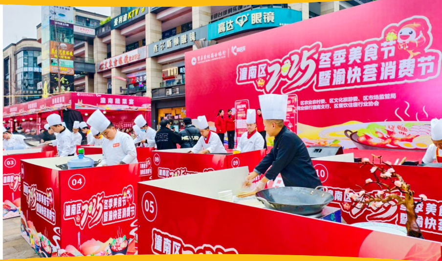
柠檬创意菜品大赛现场，大厨同台竞技。