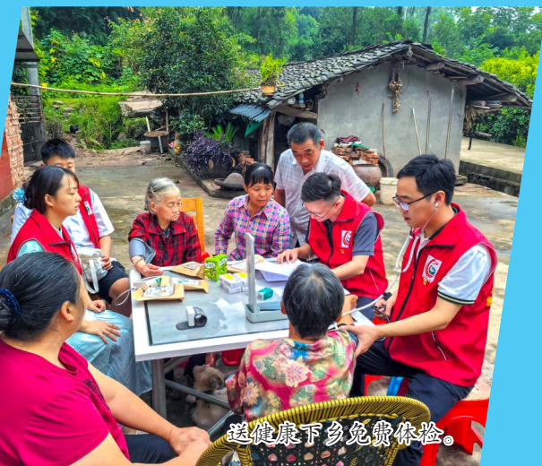
送健康下乡免费体检。