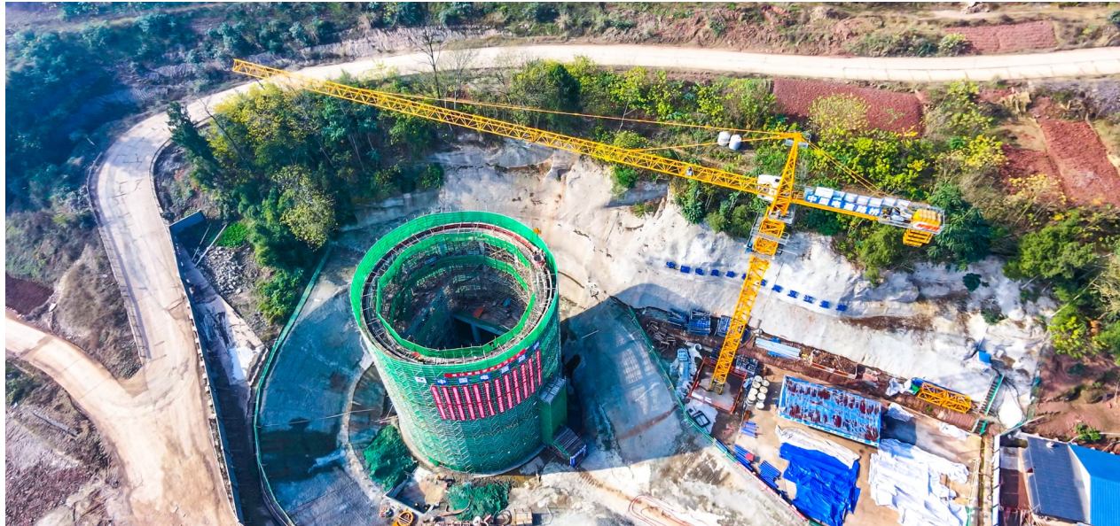
渝西水资源配置工程双江泵站泵房结构主体。

该泵站于2025年4月正式动工,9月全面转入泵房主体结构施工阶段,采用半地下式圆形钢筋混凝土结构设计,地下部分埋深达15.4米,地面以上建筑高度13.7米,泵房内径20米,壁厚厚度1米。项目建成投用后,每日可为柏梓镇供应约3.46万立