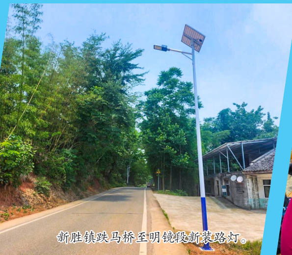
新胜镇跌马桥至明镜段新装路灯。