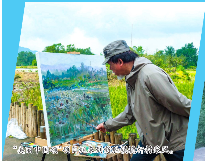
“美丽中国颂”项目组来到新胜镇桅杆村采风。