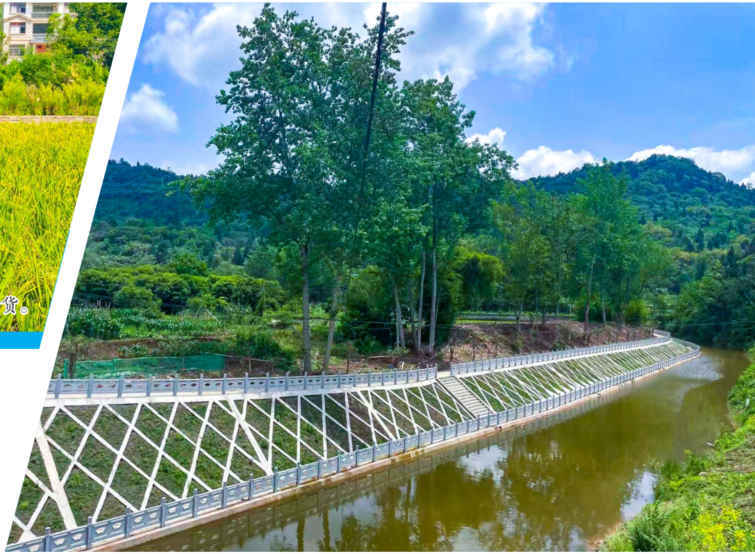
明镜河畔的“河滨路”。

寒冬时节，新胜镇的田间地头依然热气腾腾。罗盘山生姜基地里，姜农们正忙着整理土地，为下一期的播种积蓄肥力；明镜河畔的“河滨路”，游客的欢声笑语打破了冬日的宁静；“潼南村播”十强团队新胜“乡村学长”“农村大姐”的直播间内，土特产订单不断刷新。