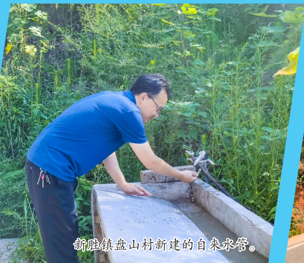
新胜镇盘山村新建的自来水管。