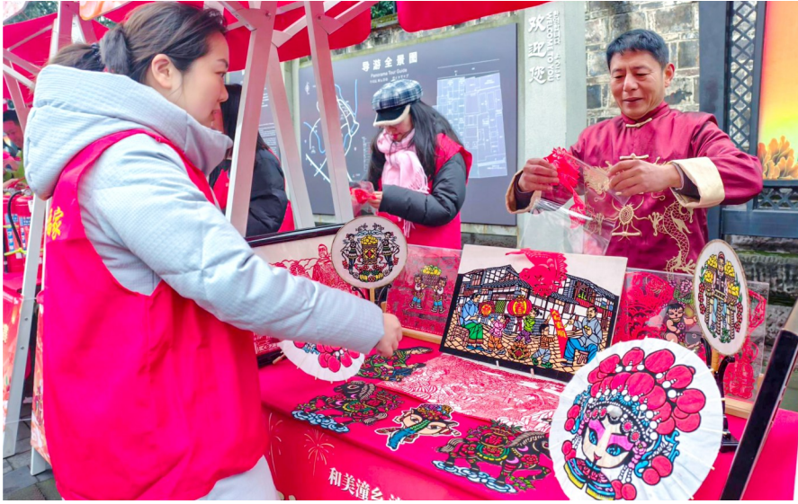
非遗传承人展示潼南剪纸。

舞台周围，同样是一番火热景象。书法家们现场挥毫，一幅幅大红春联送到乡亲们手中。墨香里，满是新春的祝福；义诊台前，医生正耐心地为老人量血压、听诊，细致的解答，让健康关怀落到实处；区应急管理局工作人员讲解冬季防火知识，手把手教大家使用灭火器，旁边的有奖问答环节更是笑声连连；非遗潼南剪纸展台上，艺术家巧手翻飞，一张张精美的