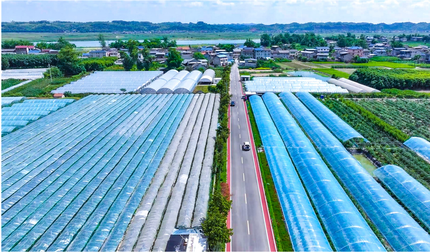
大佛坝的蔬菜基地。

“十四五”以来，大佛街道坚持以党建为统领，聚焦基层治理效能提升与集体经济发展壮大，通过一系列机制创新与实践探索，有效激发了乡村振兴的内生动力，取得了扎实成效。这些发展成效，写在党建引领下“三新”并举的创新实践中，写在治理优化、产业振兴的扎实答卷上，写在群众可感可及的幸福生活里。