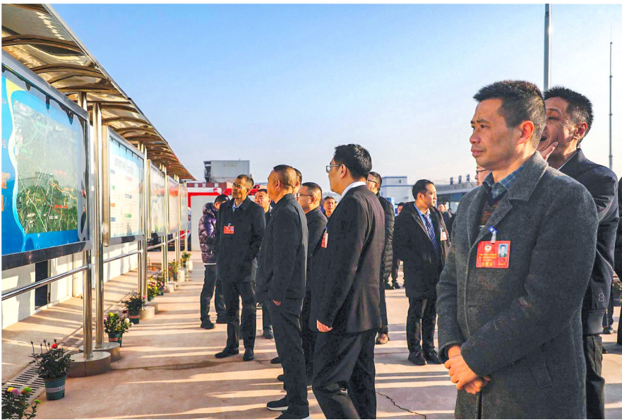
委员们开展集中视察。

通过此次集中视察，委员们对我区在推动能源绿色转型、现代农业提质增效、职业教育服务地方发展等方面取得的成效给予了充分肯定。大家纷纷表示，将充分发挥自身专业优势，把视察中的所见所悟转化为履职实效，围绕进一步优化营商环境、强