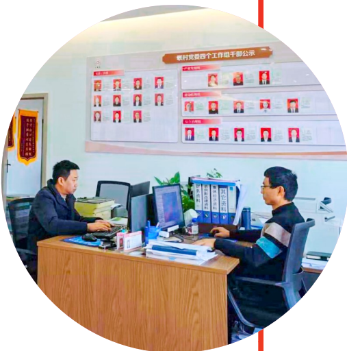
相邻村(社区)的工作人员在联村党群服务中心办公。