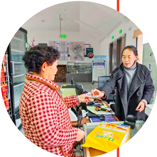
群众在“积分超市”里用积分兑换生活用品。