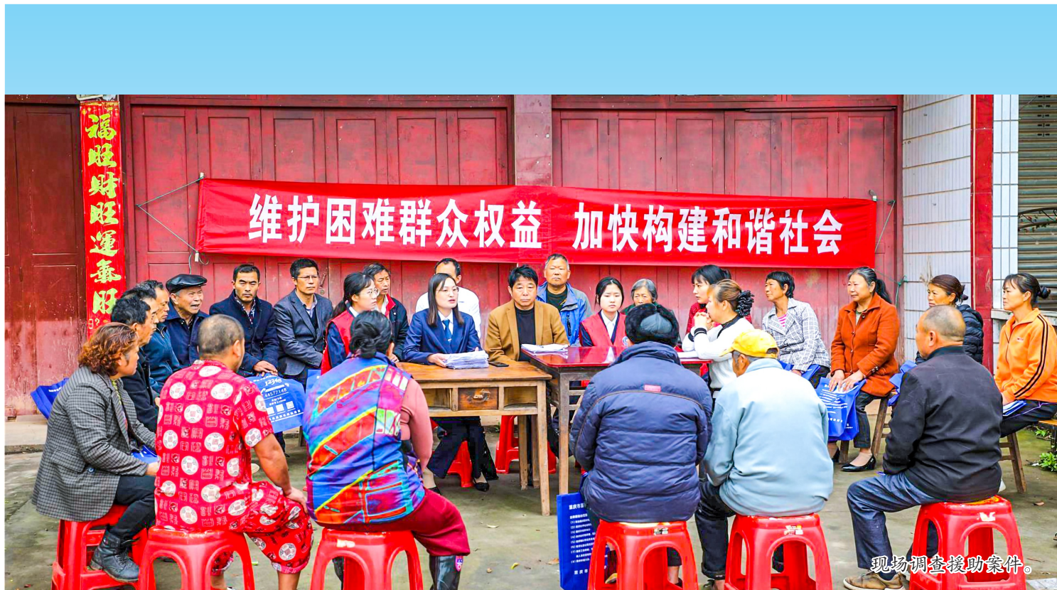
现场调查援助案件。