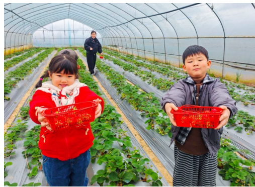
游客在大佛街道四季鲜果草莓园采摘。