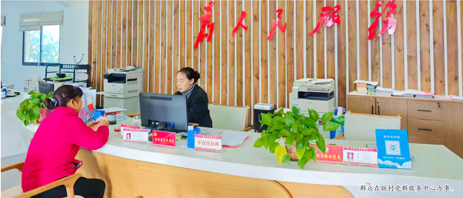
群众在联村党群服务中心办事。