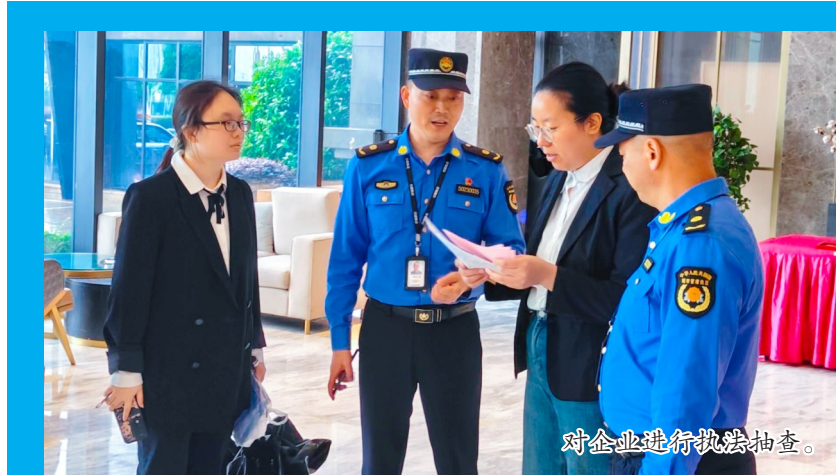
对企业进行执法检查。