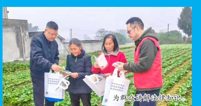
为群众讲解法律知识。