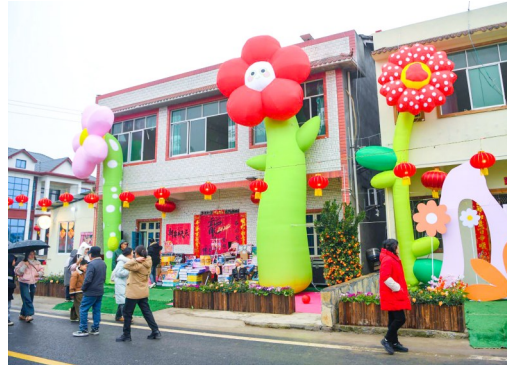
游客在大佛街道休闲娱乐。