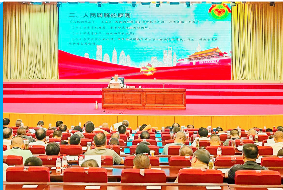
“法律明白人”培训现场。