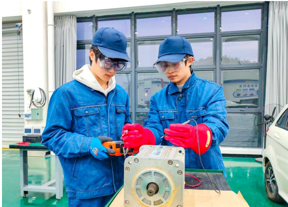
学生手持万用表测量电池单体电压。