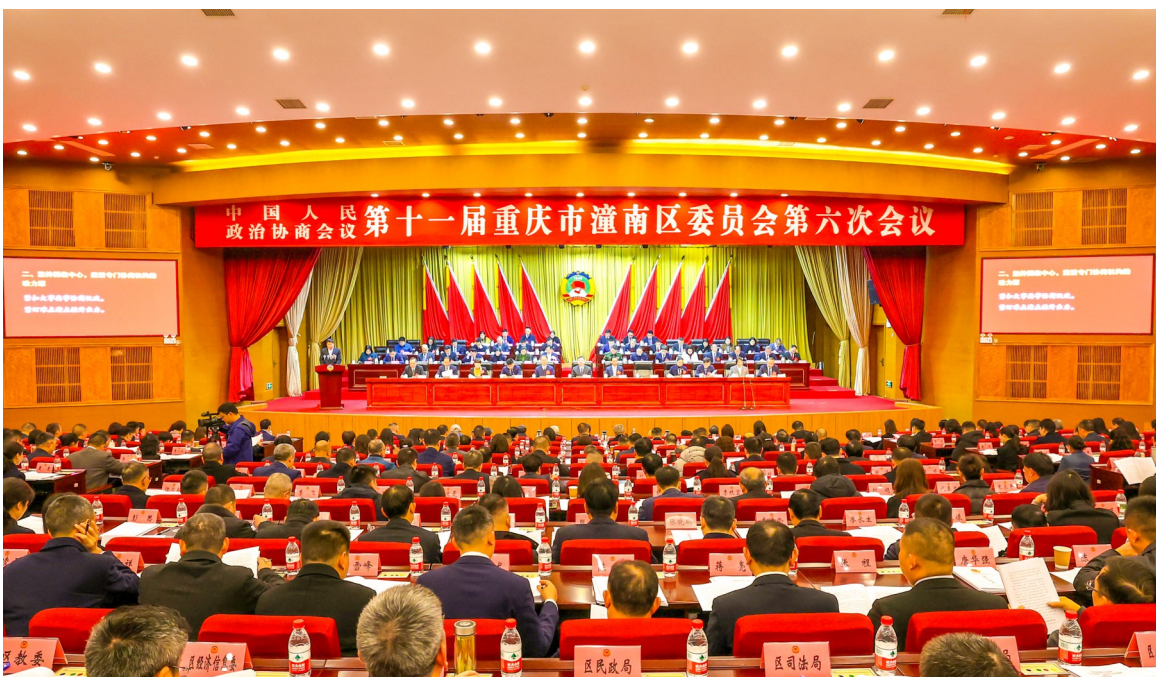
记者 徐 肯

本报讯(两会报道组)1月7日,中国人民政治协商会议第十一届重庆市潼南区委员会第六次会议在区委党校学术报告厅开幕。