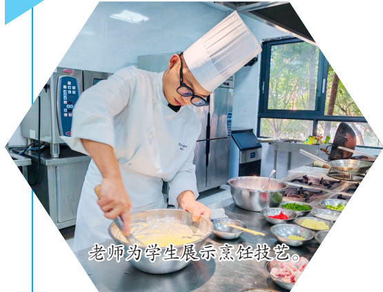
老师为学生展示烹饪技艺。