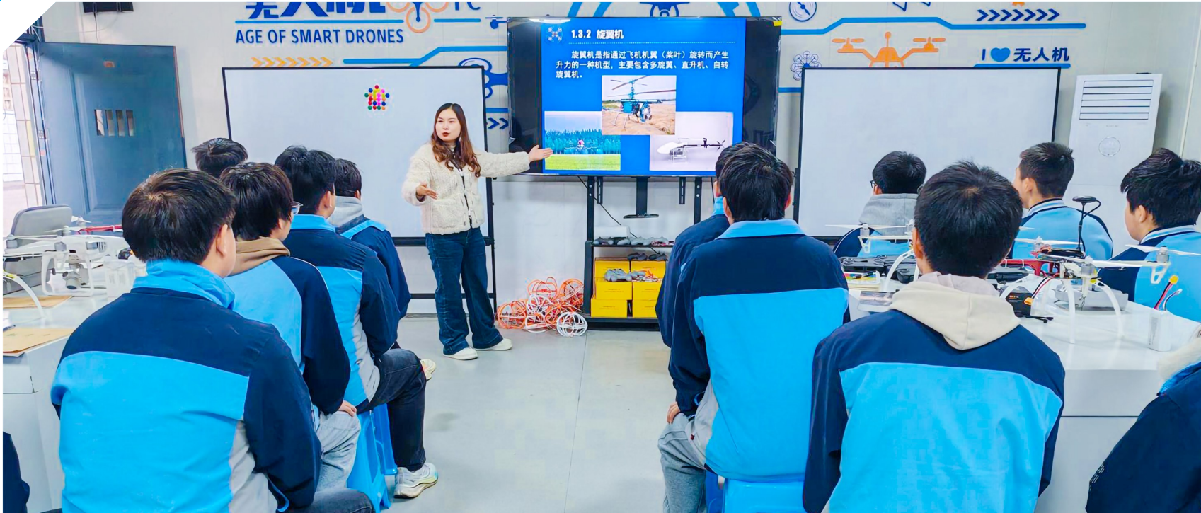
老师为职教中心学生上无人机理论课。