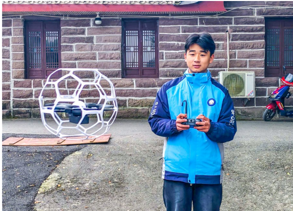
学生进行无人机训练。