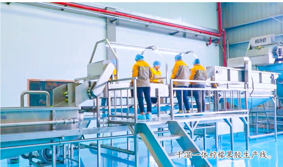
干湿一体柠檬果胶生产线。