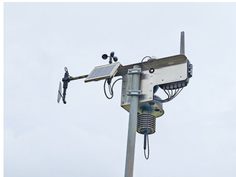
枳壳基地物联网传感器。

“智能化不是单一环节的升级,更能带动产业链上下游协同发展。”铁得祥表示,未来将持续深耕数字技术与种苗培育的深度融合,加大新品种试育与示范推广力度,助力潼南打造立足成渝、辐射西部、面向全国的农业科技创新与种苗供应基地,为区域现代农业高质量发展注入持久动能。