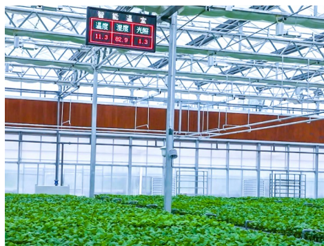
精准控温的数字种苗工厂。