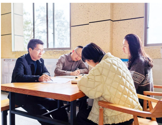
老师们互相交流学习要点。