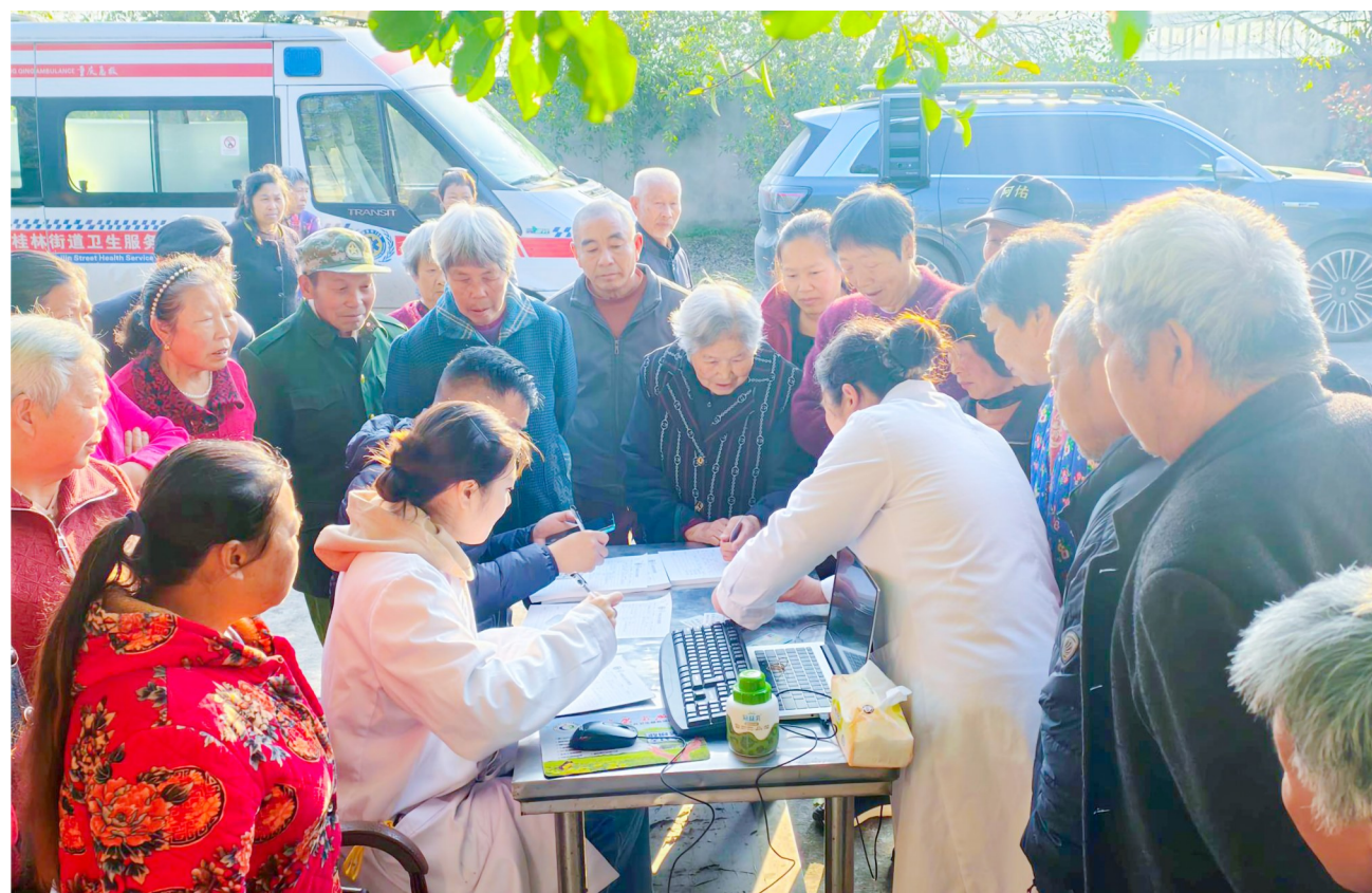
医护人员为体检老人录入信息。

今年的老年健康体检福利再升级,在常规体检项目基础上,新增胸部数字化X线摄影正位检查和糖化