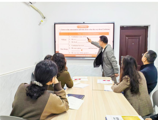
英语教研讨论现场。