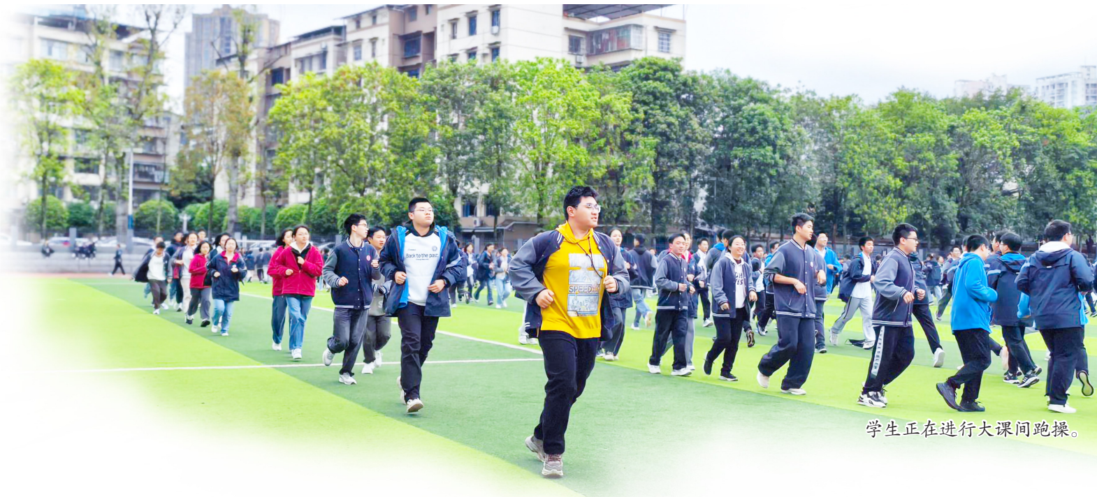
学生正在进行大课间跑操。