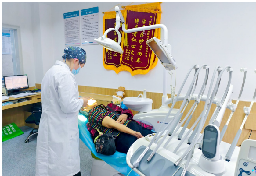
牙医为老人检查牙齿。