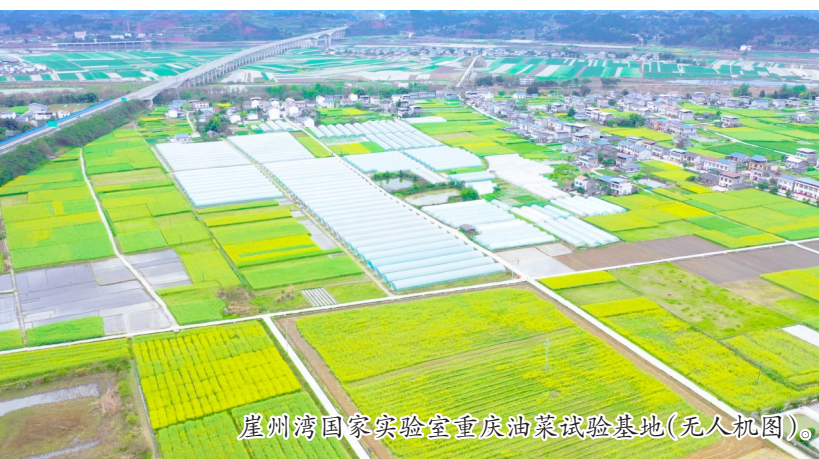
崖州湾国家实验室重庆油菜试验基地(无人机图)。

实。”基地现场负责人介绍。据了解，这片试验田内汇聚了300份油菜种质资源群体，每份资源都设置了3个重复组。科研人员通过对这些种质资源进行全方位的性状表型采集，深度挖掘控制油菜重要