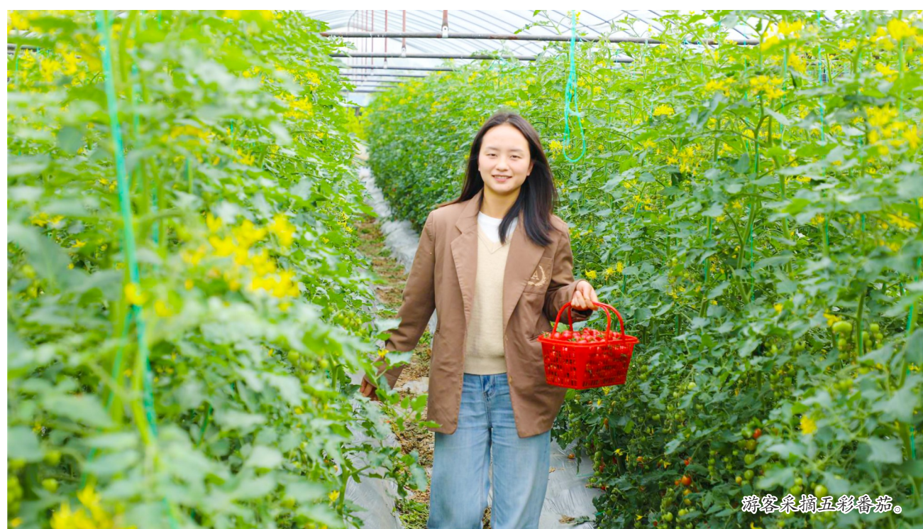
游客采摘五彩番茄。

鲜甜,瞬间拉近了和游客的距离。不少游客尝完就直奔藤架间,三五成群穿梭在绿叶红果中,有的举着手机拍照打卡,把春日的五彩番茄定格下来;有的带着孩子手把手教采摘,让孩子感受亲手收获的快乐,整个大棚里满是欢声笑语,烟火气十足。