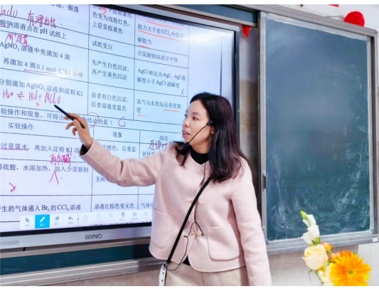
老师为学生答疑解惑。