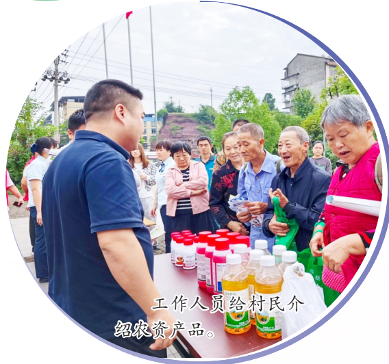
工作人员给村民介绍农资产品。