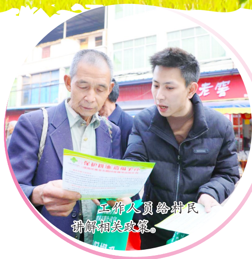
工作人员给村民讲解相关政策。

在生态保护和电商发展方面,区供销社构建了完备的废弃农膜回收利用网络,建成回收网点328个,全年回收废弃农膜618吨,完成年度目标任务的111.53%;回收肥料包装物135.67吨,完成年度目标任务的100.5%。正兴商贸公司组织开展电商直播培训,着力提升员工直播带货技能。智慧农服潼南分公司正建设约200亩柠檬标准化、智慧化生产示范基地。