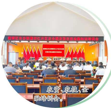
农资、农技、金融培训会。