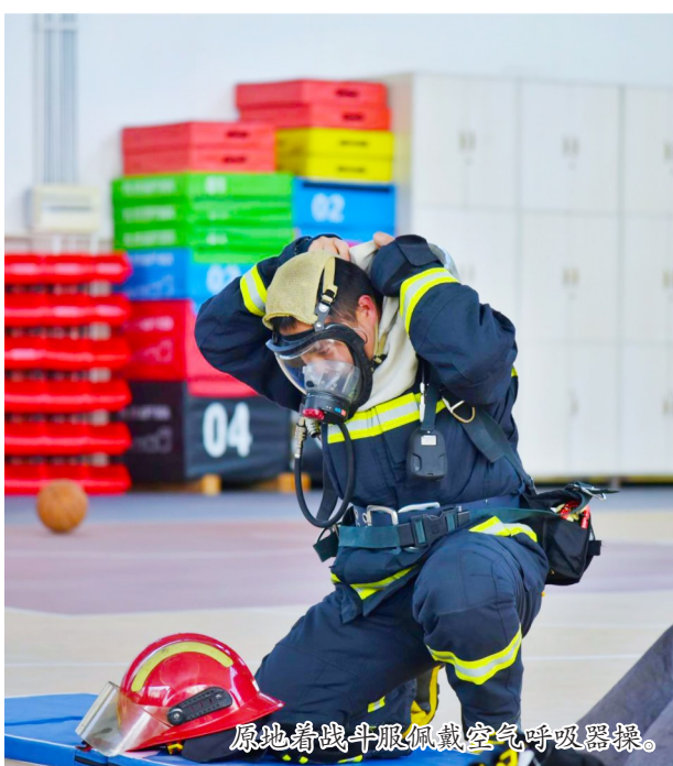
原地着战斗服佩戴空气呼吸器操。

本报讯(记者 李彦亭)4月8日至10日,区消防救援局举办2026岗位练兵动员部署暨春季比武竞赛,全面检验队伍执勤岗位练兵成效,不断夯实基础、磨砺技能、提质强能。