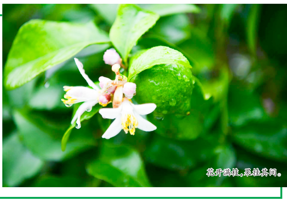
花开满枝,果挂满树。

作为潼南特色优势农业产业,柠檬成为带动乡村振兴的“黄金产业”。依托适宜的气候与土壤,潼南柠檬实现规模化、标准化种植,构建起种植、加工、销售、文旅融合的全产业链,产品出口30多个国家和地区,品牌价值超280亿元,成为潼南农业的亮眼名片。