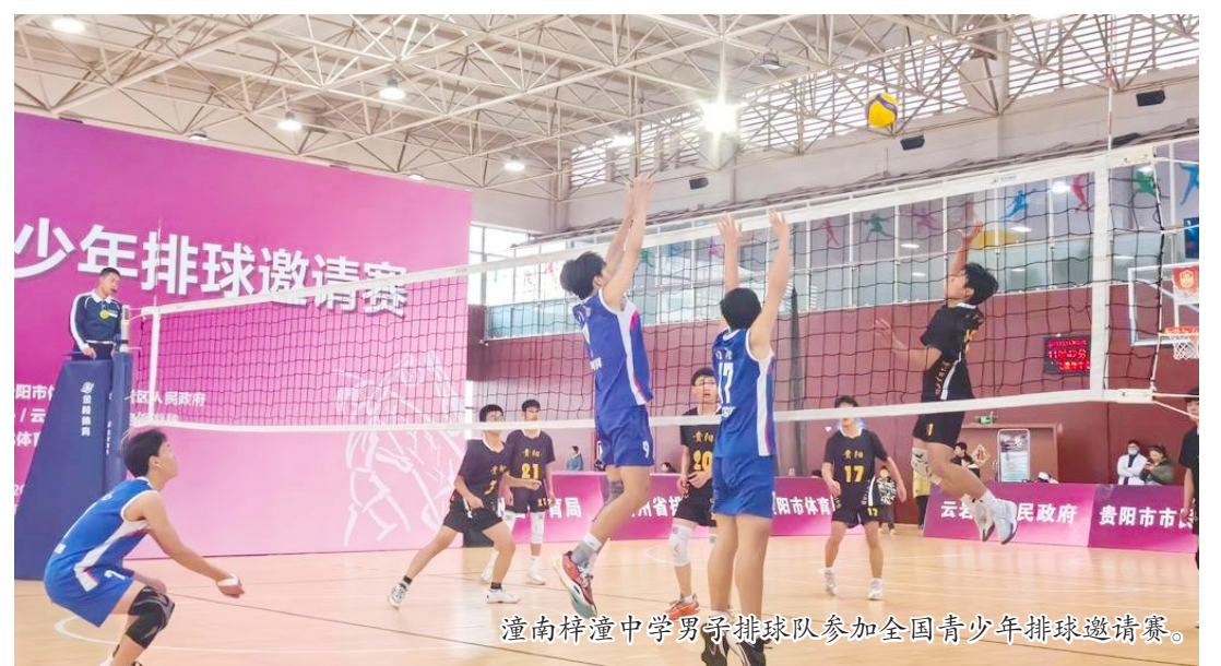
潼南梓潼中学男子排球队参加全国青少年排球邀请赛。