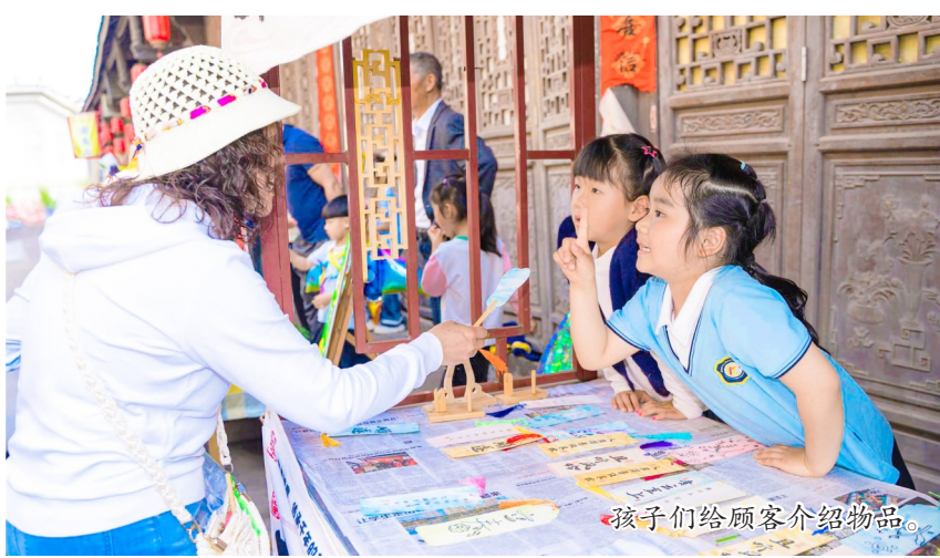
孩子们给顾客介绍物品。

本报讯(记者 李彦亭)近日,双江镇中心幼儿园在蔡家院子内开展了一场别开生面的“爱心小集市,温暖满童心”主题活动。全体大班幼儿、家长及教师共同参与,通过一场爱心义卖,让孩子们在实践中成长。“快来看看我的小汽车,只要3元钱!”“这本故事书很有趣,买一送一哦!”上午9点,“爱心小集市”正式开市。每个摊位前摆放着孩子们精心设计的海报和琳琅满目的商品,孩子们大胆地向“顾客”展示自己的物品。稚嫩的叫卖声此起彼伏,孩子们在真实交易场景中锻炼了沟通表达与社交互动能力,学会了如何介绍商品,吸引顾客,体验了劳动与分享带来的快乐。家长们不