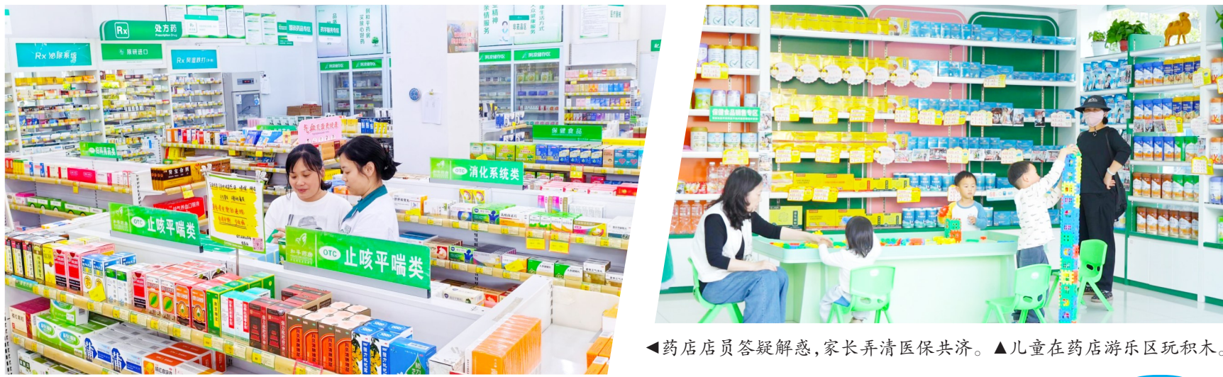
◀药店店员答疑解惑,家长弄清医保共济。▲儿童在药店游乐区玩积木。