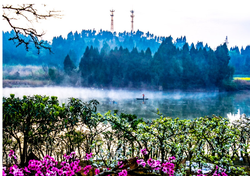
特约记者 李祯雪 摄