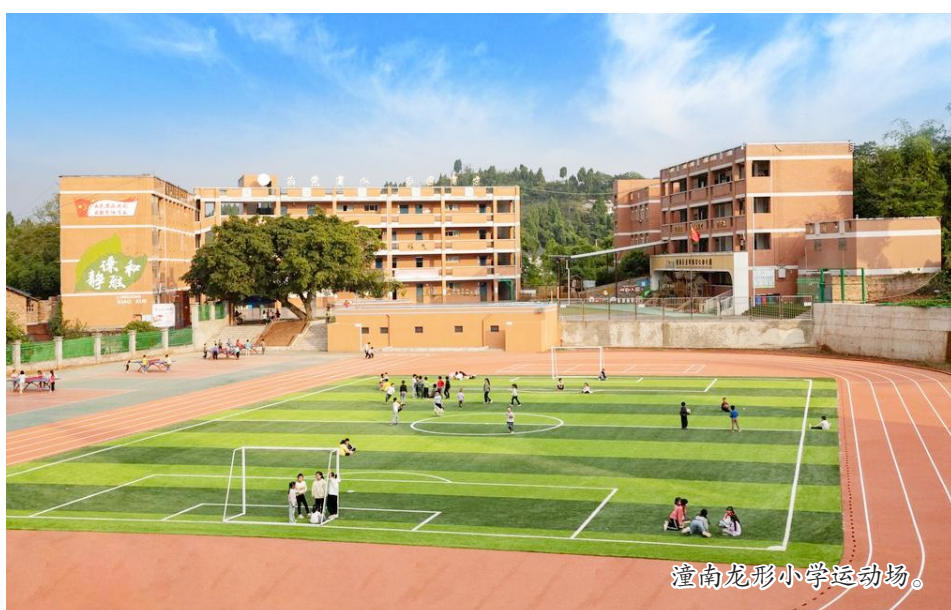
潼南龙形小学运动场。

健康是青少年成长成才的根基。2026年教育部“新春第一会”锚定深入落实“健康第一”核心部署，重庆教育系统闻令而动，将学生身心健康作为基础性、先导性工程，系统构建“大健康”育人格局。为全面展现重庆教育系统在促进青少年身心健康方面的创新探索与生动实践，特别推出“健康第一，重庆教育在行动”大型融媒体宣传报道。