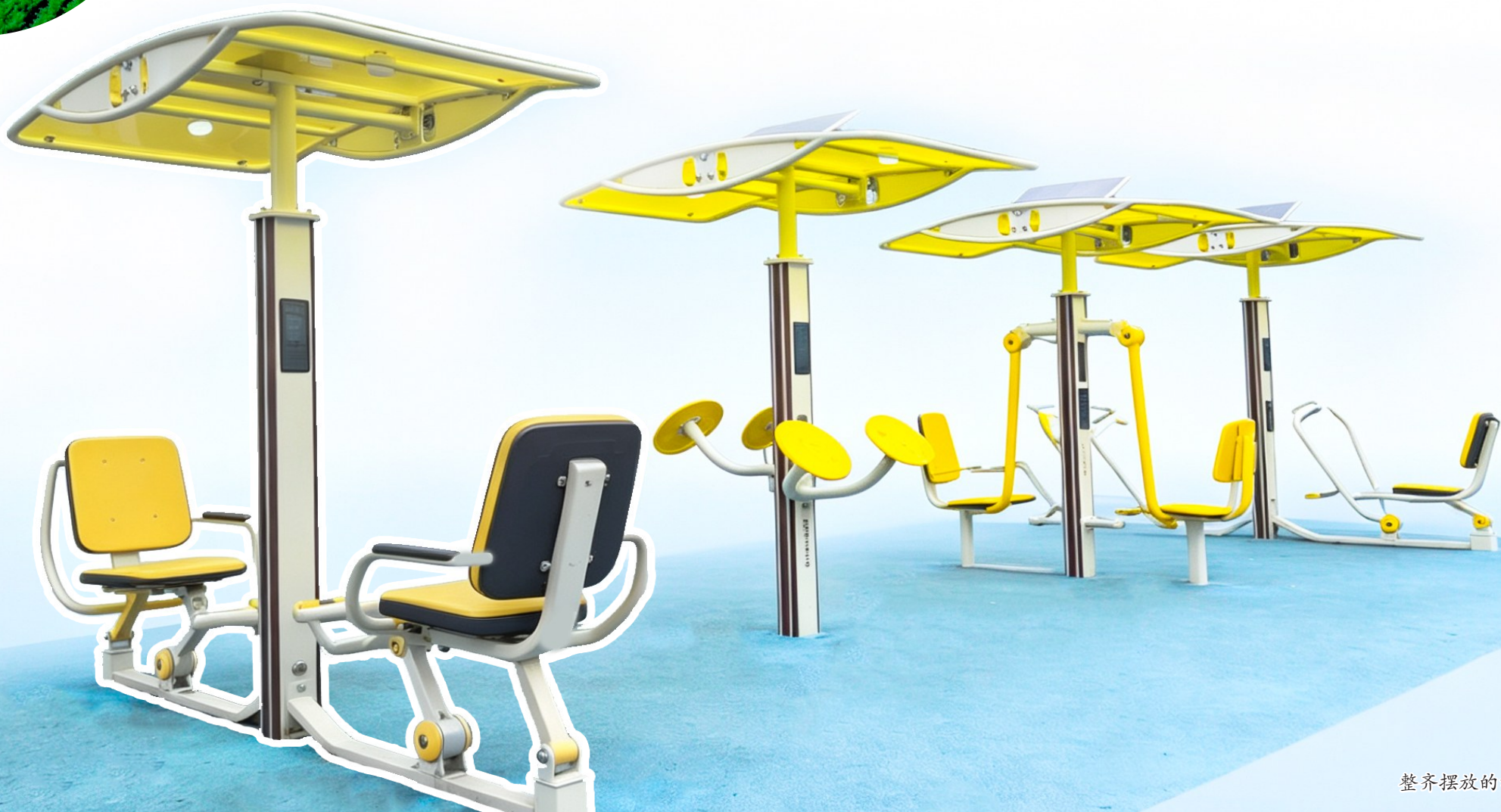
整齐摆放的智能健身器材。

如今,走在潼南的街头巷尾,老旧小区的楼道变得整洁明亮,乡村的道路宽阔通畅,社区的便民服务站贴心周到,校园的周边环境安全有序——每一处细微的变化,都蕴藏着这座城市对市民最深情的关怀,让群众生活得更方便、更舒心、更美好。