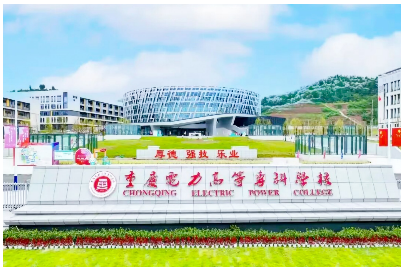
重庆电力高等专科学校(潼南校区)。

荣获“全国工人先锋号”，是荣誉，更是责任，学院相关负责人表示，将以此次获评“全国工人先锋号”为契机，持续弘扬劳模精神、劳