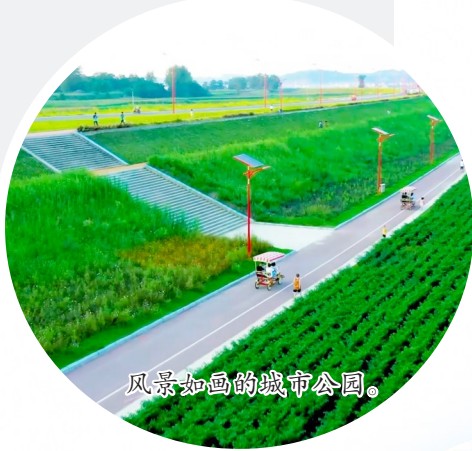
风景如画的城市公园。

幸福城市的建设,从来不是一蹴而就。潼南累计完成274个老旧小区改造,建成多处口袋公园与健身设施,让公园绿化服务半径覆盖率超88%,用实打实的数据诠释着“人民城市人民建,人民城市为人民”的理念。唯有以“绣花功夫”做好民生文章,才能让城市更有温度,让群众的幸福更有质感、更可持续。