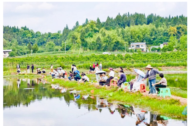
游客尽享垂钓之乐。