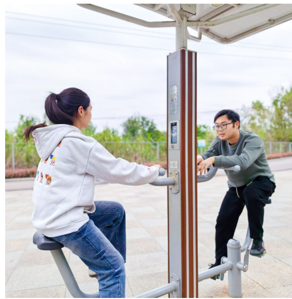
市民使用智能健身器材健身。