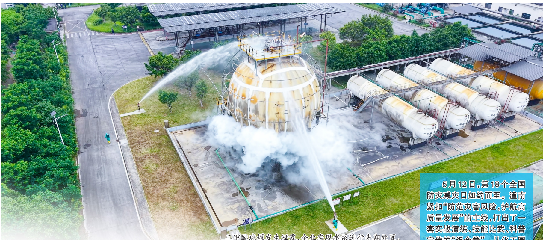
二甲醚球罐发生泄露，企业实现水系进行先期处置。