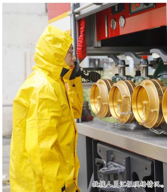
救援人员汇报现场情况。

5月12日，第18个全国防灾减灾日如约而至。潼南紧扣“防范灾害风险，护航高质量发展”的主线，打出了一套实战演练、技能比武、科普宣传的“组合拳”。从化工园区的惊心动魄，到竞技场上的汗水拼搏，再到广场上的温情互动，潼南以“练、赛、宣”三位一体的模式，将抽象的安全概念转化为看得见、摸得着的实战能力，全力守护一方平安。