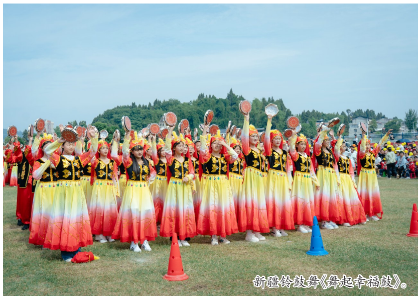
新疆铃鼓舞《舞起幸福鼓》。