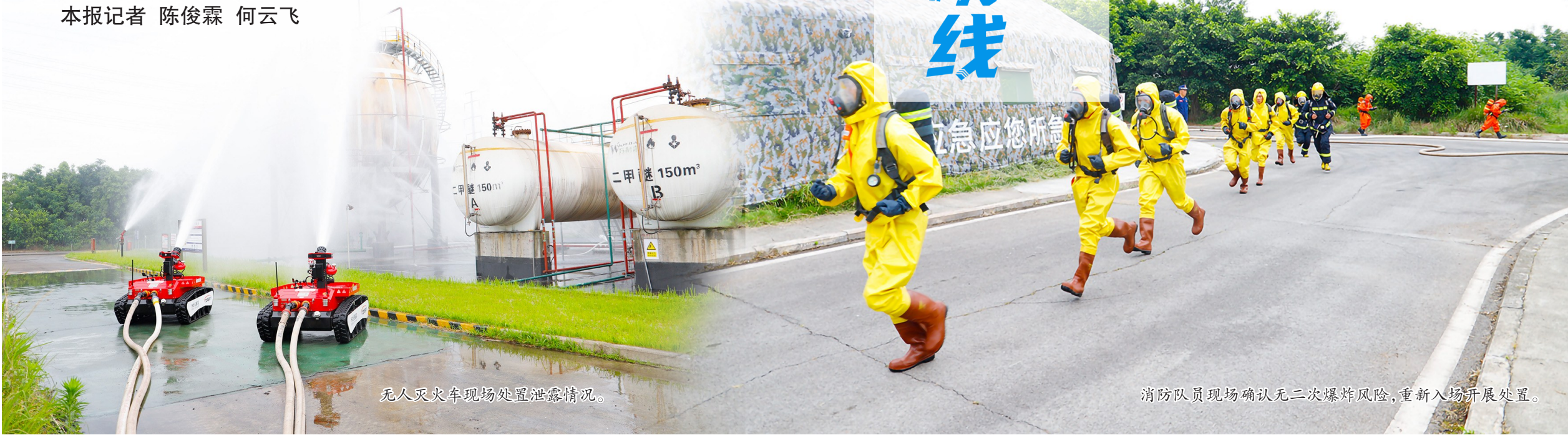
无人灭火车现场处置泄露情况。