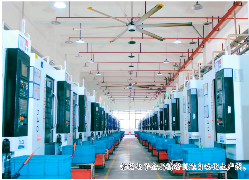
景裕电子金属精密制造自动化生产线。

据悉，景裕电子工业设计中心聚焦铝镁合金笔记本外壳，累计持有61项核心专利，参与多项国家及行业标准制定，先后获评国家级绿色工