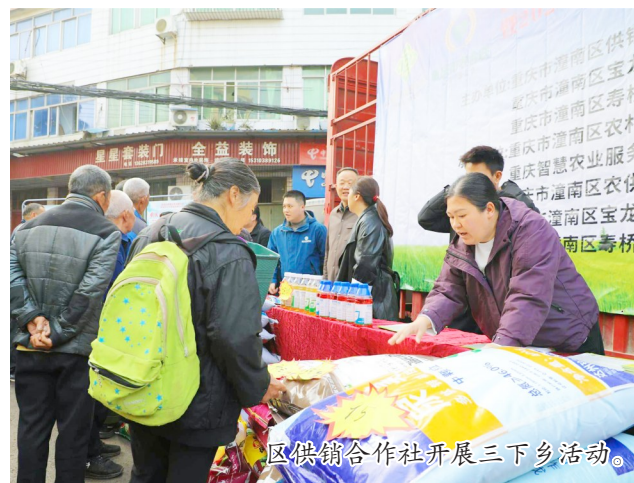
区供销社开展三下乡活动。