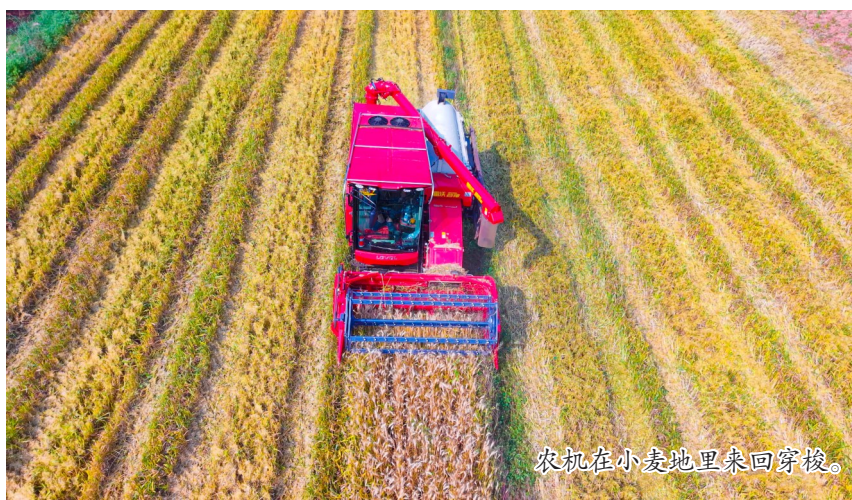
农机在小麦地里来回穿梭。

今年夏收期间，上和镇的麦田同样呈现一派繁忙景象。智慧农服公司的收割机队进村入田，为托管农户提供标准化的机械收割服务。看着颗粒归仓的丰收成果，村民们脸上洋溢着喜悦的笑容。此外，重庆智慧农服集团还依托上和镇三岭村、群力镇小龙村等地的1192亩“共享耘”玉米示范基地，持续开展无人机飞防与机收服务，进一步推动了“农服区县