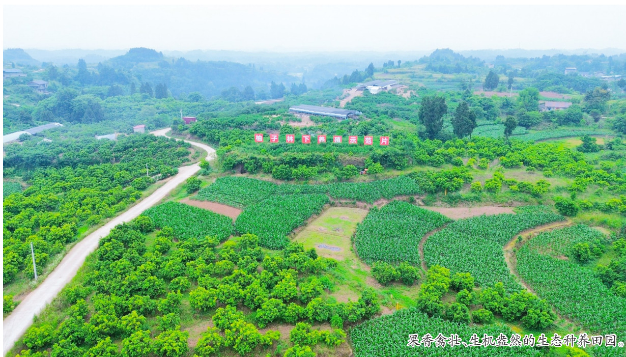
果香禽甜、生机盎然的生态种养田园。

本报讯（记者 徐利 张峻豪）走进宝龙镇颖欣养殖家庭农场，连片柚子林枝繁叶茂，成群的鸭鸭穿梭在林间草丛，或悠闲踱步，觅食虫草，或追逐嬉戏，振翅欢鸣。阵阵鸭鸣伴着林间风声，勾勒出一幅果香禽甜、生机盎然的生态种养田园图景。