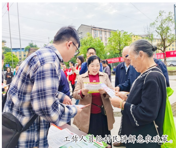
工作人员给村民讲解惠农政策。

初夏时节，潼南广袤的田野上麦浪翻滚、金穗飘香，万余亩小麦陆续迎来成熟期。与往年不同的是，今年的夏收画卷中多了一抹亮眼的“供销红”——联合收割机在田间纵横驰骋，供销社的技术员奔波在各个村社的收割一线。这幅热闹繁忙的丰收图景，正是我区供销社深化推进“三方共耕”模式、全力护航夏粮颗粒归仓的生动写照。