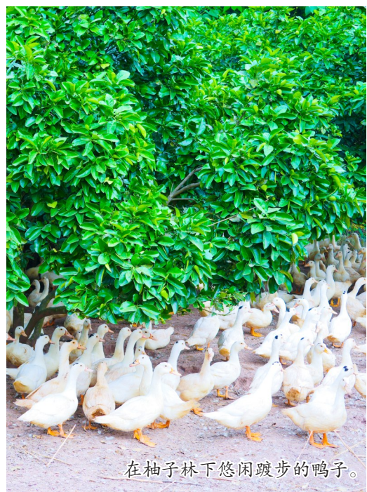
在柚子林下悠闲踱步的鸭子。