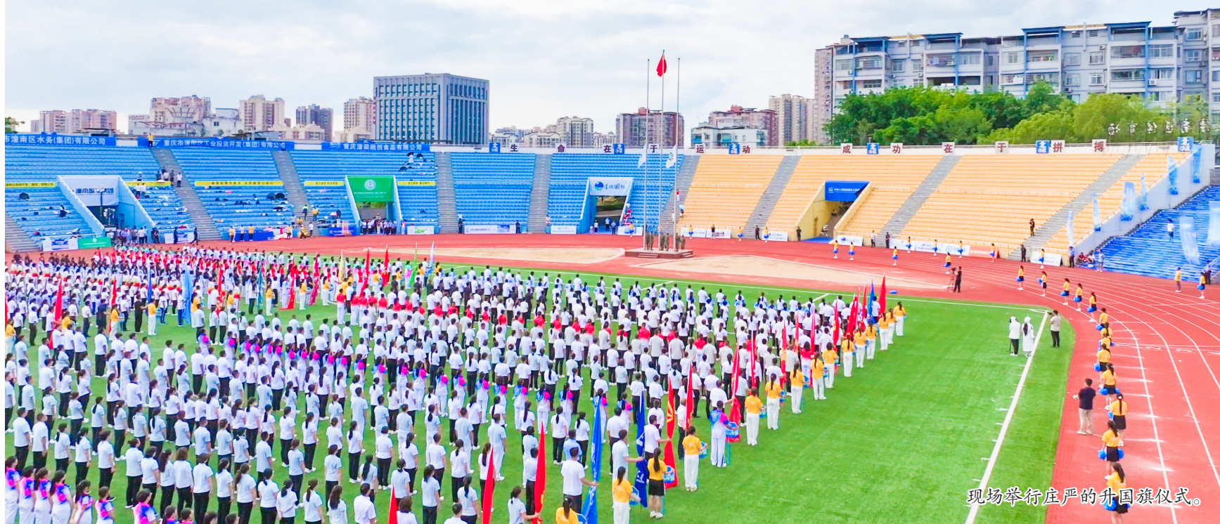
现场举行庄严的升国旗仪式。