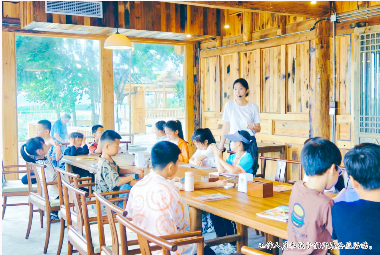
工作人员和孩子们开展公益活动。