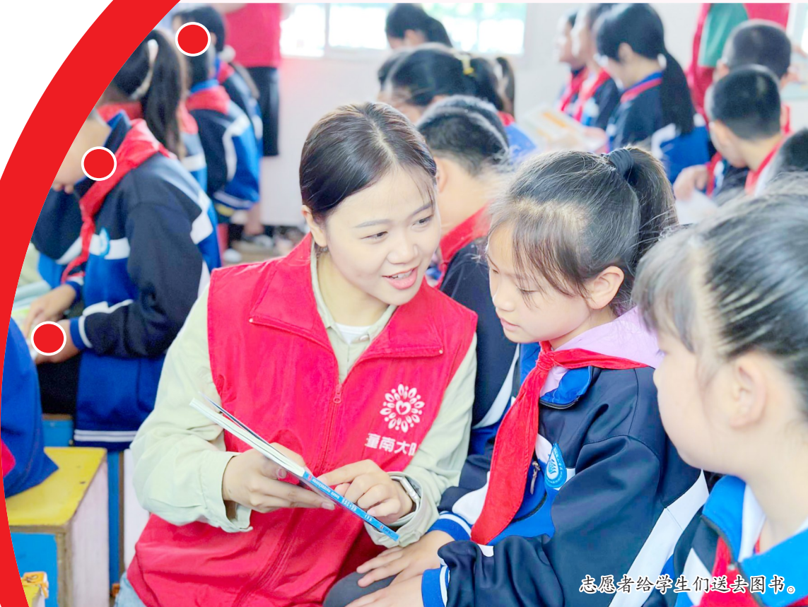
志愿者给学生们送去图书。