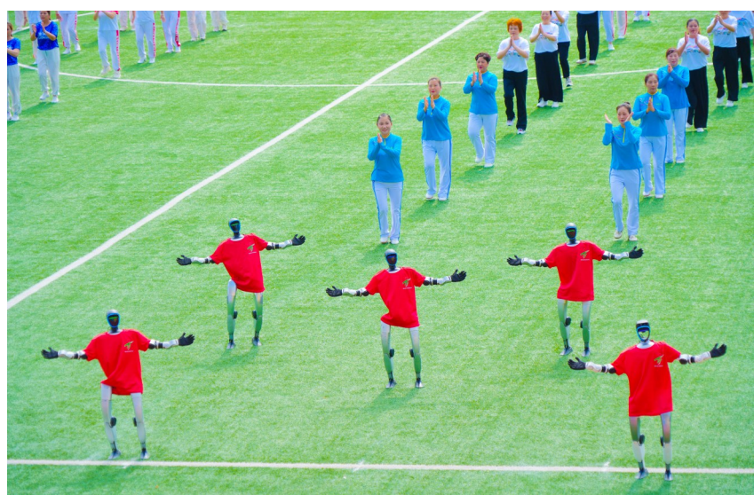
开幕式上演机器人特色表演。

太极拳表演行云流水、舒缓圆活，武术表演则刚劲有力、气势磅礴，传统体育文化与现代健身理念