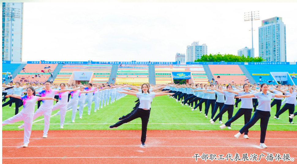
干部职工代表展演广播体操。