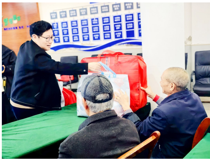
区慈善会社区阳光基金为120名困难老人送上御寒棉被。