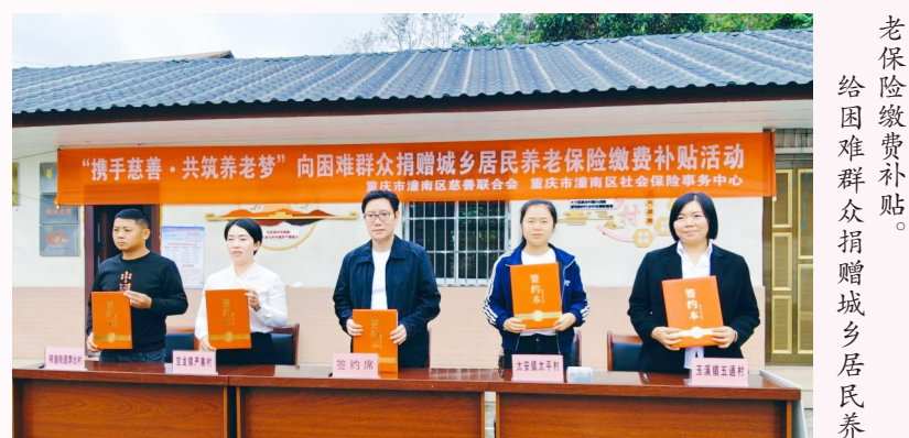
老保险缴费补贴。给困难群众捐赠城乡居民养老保险缴费补贴。

这一模式的突破性在于构建了“法院筛查、民革定制、慈善执行”的三位一体闭环体系。“过去慈善救助多是普惠性的，现在我们可以精准定位到司法领域的‘死角’。法院利用办案优势精准识别救助对象，民革支部负责方案制定与监督，慈善会负责基金专管专用。三方各司其职，确保了每一分善款都用在最需