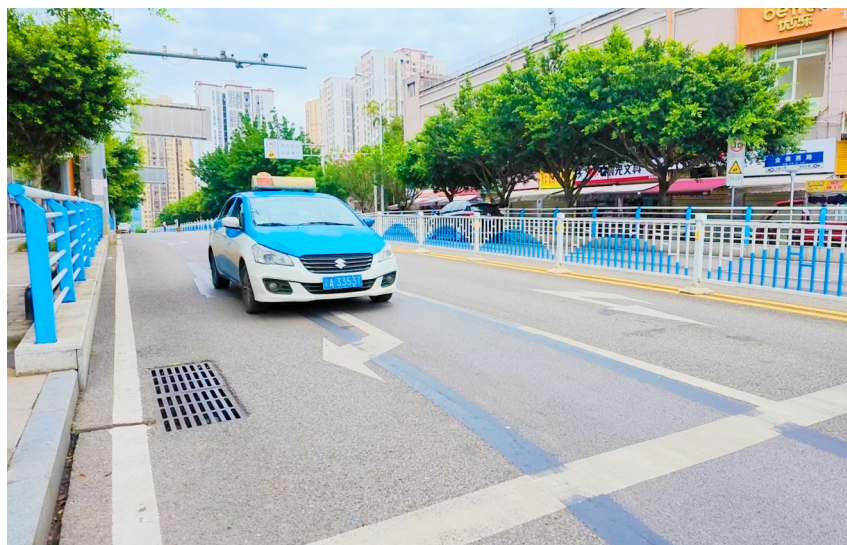
改造后东风大道与金佛大道交叉口“2进2出”道路。

近日,厦门某学校升旗仪式上一名女教师为身旁男士撑伞的画面,被恶意解读为“讨好校领导”,引发全网讨伐。然而真相却是,这位男士是女教师刚做完手术、年近七旬的返聘老教师父亲,女儿撑伞实为尽孝。短短24小时,温情一幕被断章取义成全网闹剧,当事人遭受了无妄的网络暴力。