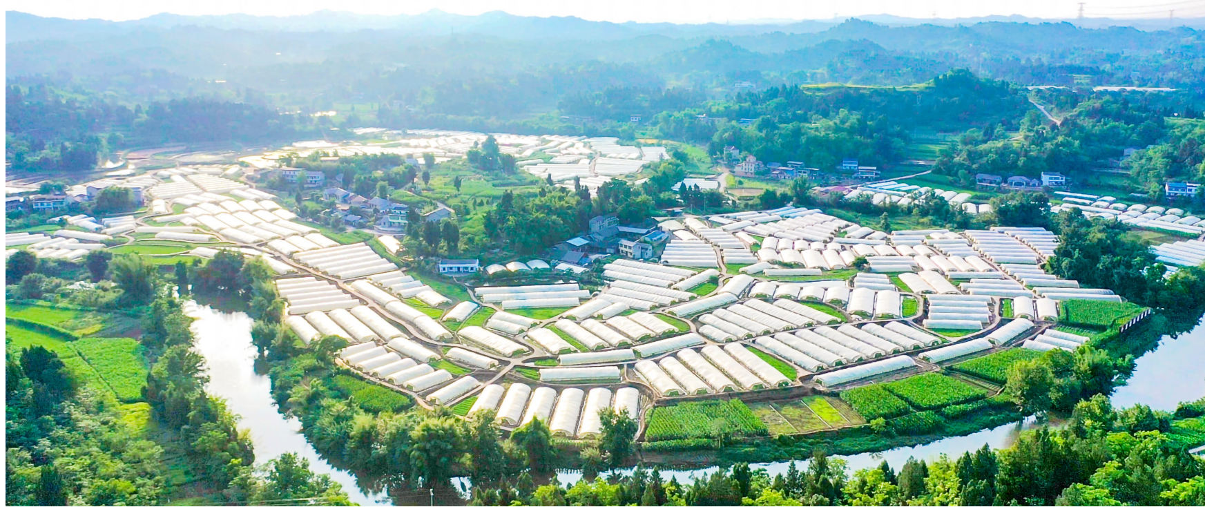
800亩空心菜基地航拍。

下一步,我区将继续深化农业科技应用,延伸蔬菜产业链条,让特色产业红利惠及更多周边群众。