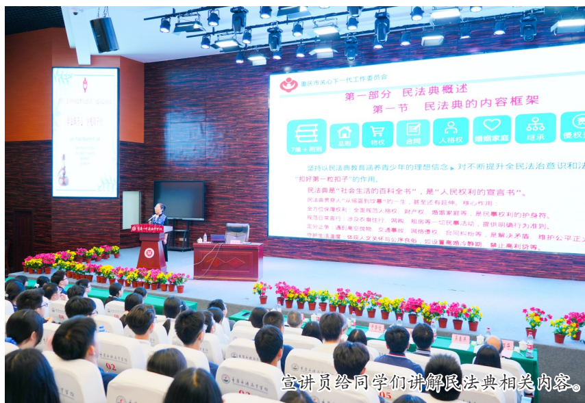
宣讲员给同学们讲解民法典相关内容。

同日,在潼南第一中学,一场关于《强化“三观”正能量 争当“三好”青少年》的宣讲同样热烈。宣讲员