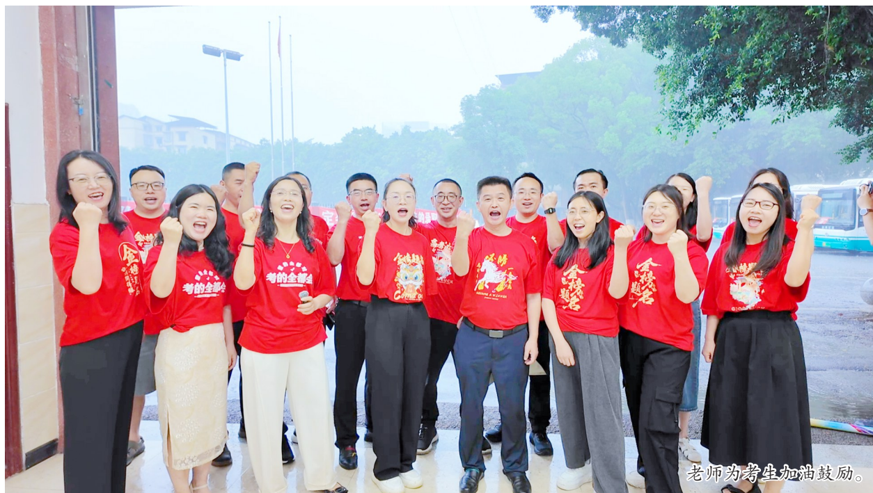
老师为考生加油鼓励。