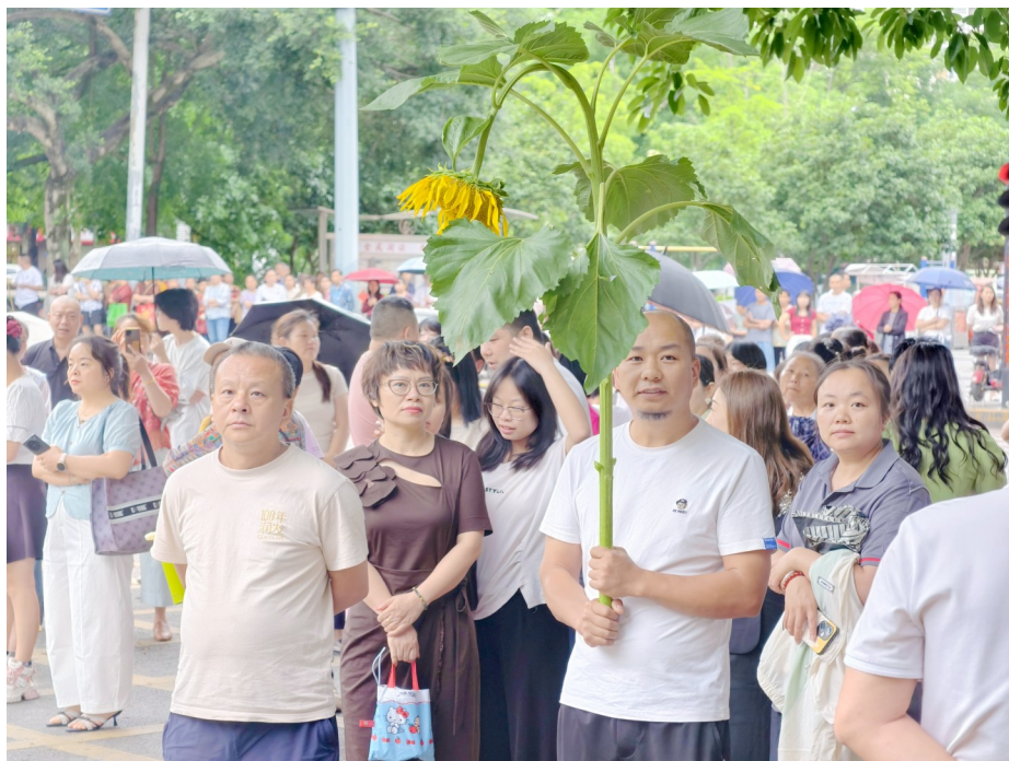
家长手举向日葵祝考生“一举夺魁”。