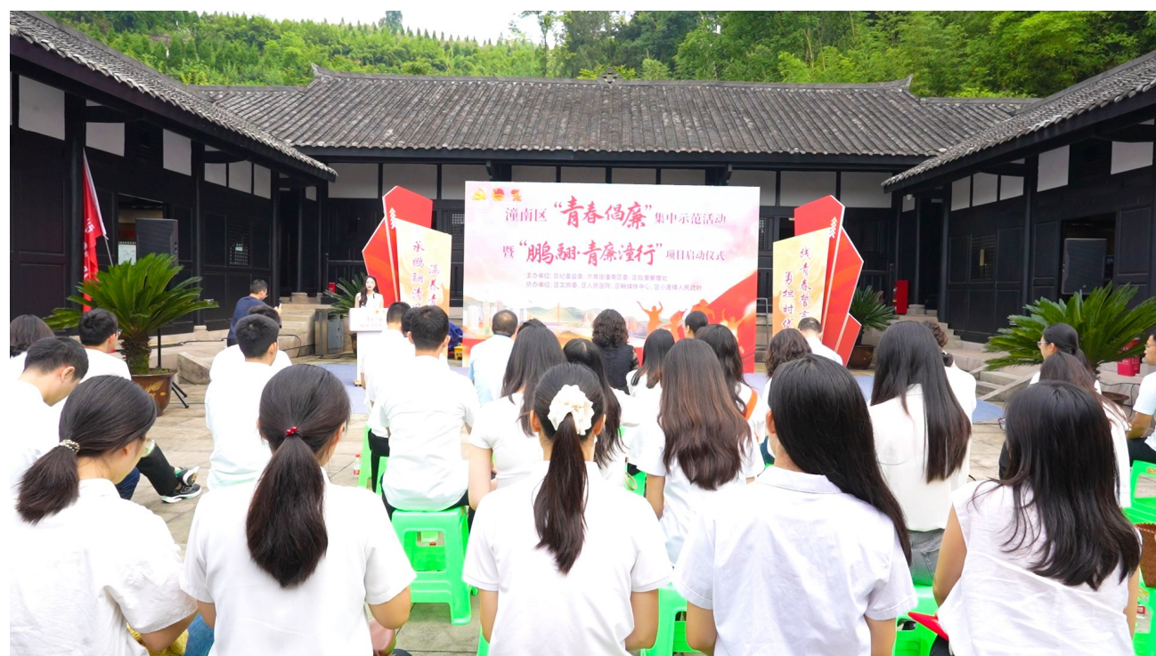
青年干部作廉洁主题发言。

据了解,“鹏翻·青廉潼行”项目通过组建青年宣讲团常态化开展廉洁宣讲、聚焦入职提拔等关键节点开展青年干部家访、在政务大厅推行标准化清廉窗口服务、组织重点岗位青年干部旁听庭审以案示警等形式,将廉洁教育贯穿青年成长全周期,推动崇廉尚洁融入青年干部日常工作生活。