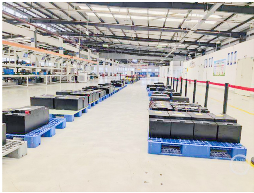
拆解出的汽车电池包再利用而生产出的储能产品。