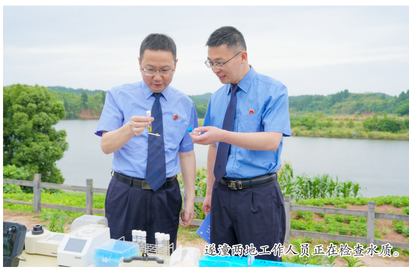
遂潼两地工作人员正在检查水质。

“遂潼检察协作服务专窗”揭牌,明确了包括公益诉讼协作、未成年人保护、线索移送渠道、便民服