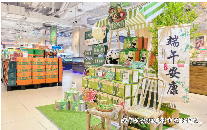
端午元素摆在超市显眼位置。

据悉,为保障端午节市场有序供应,潼南各大商超、农贸市场提前统筹部署,全力做好应季商品保供稳价工作。目前,各类成品粽子、新鲜粽叶、优质糯米及端午配套食材货源充足、品类齐全、价格平稳,可充分满足市民多样化、个性化的节日消费需求。