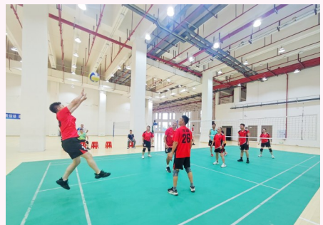
气排球比赛选手奋力拼搏。