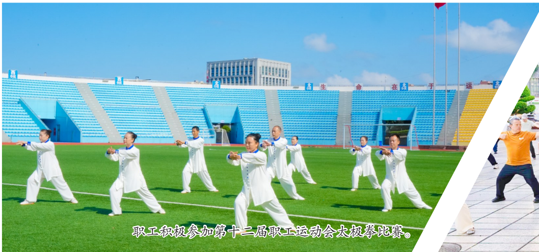
职工积极参加第十三届职工运动会太极拳比赛。