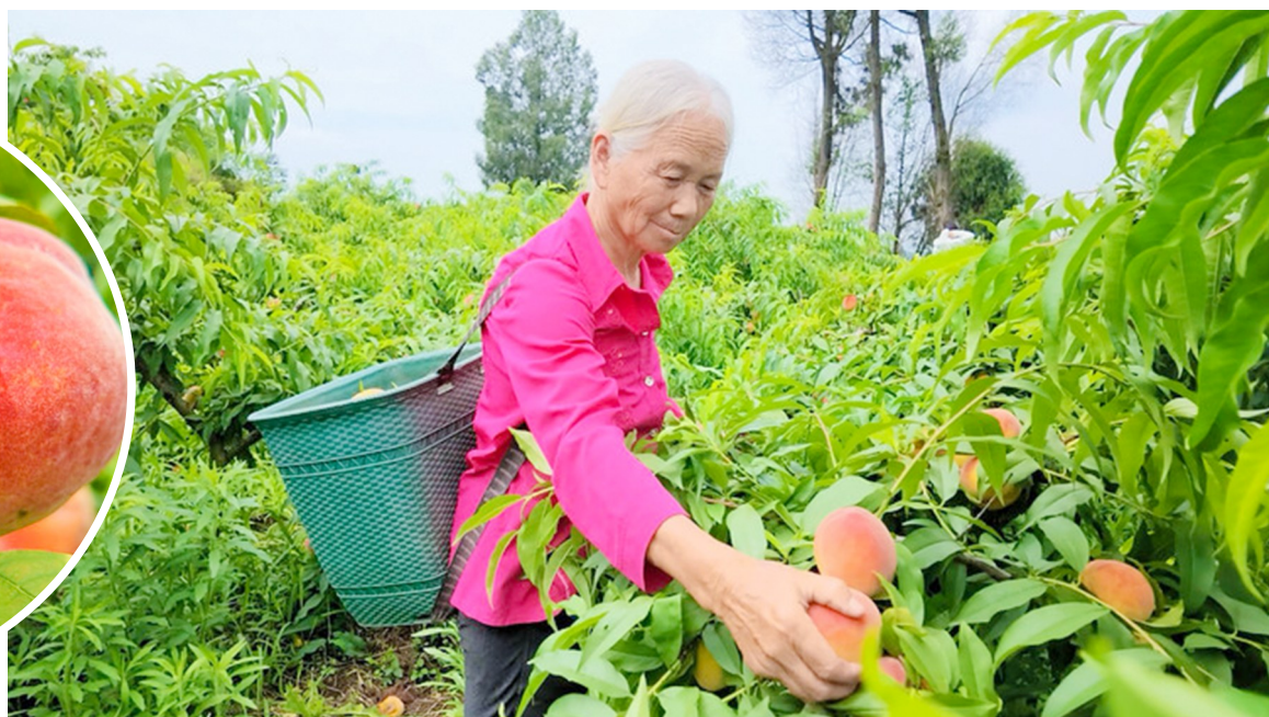
工人正在采摘黄桃。

本报讯（记者 徐利）初夏时节，微风送爽，正是瓜果飘香的丰收季。走进潼南区古溪镇龙滩村，200余亩黄桃种植基地里一派生机盎然。连片的桃树枝繁叶茂，沉甸甸的黄桃压弯了枝头。金黄泛红的果实掩映在翠绿之间，浓郁的果香随风四溢，令人垂涎欲滴。林间，果农们正穿梭忙碌，熟练地采摘、分拣、装箱，将这份初夏的甜蜜打包发往各地。