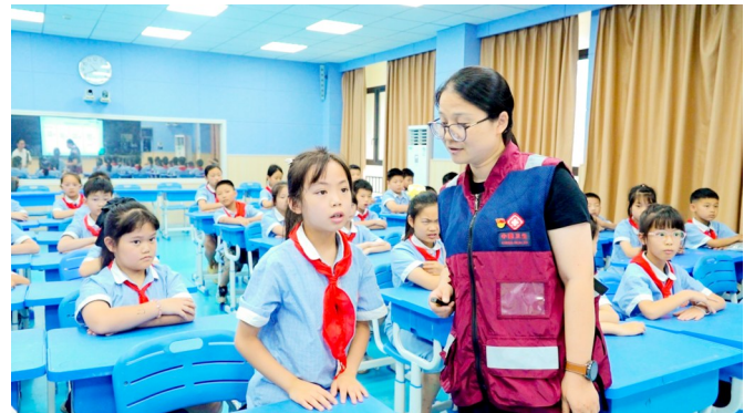
疾控专家向学生普及防缺碘知识。

本报讯(记者 张凡 实习记者 胡文轩)日前,区疾控中心、梓潼街道社区卫生服务中心、琼江小学及中盐集团渝西南有限责任公司四方支部,在琼江小学联合开展“科学监测防碘缺,实干担当护安康”主题党日活动,以党建引领公共卫生服务提质增效。