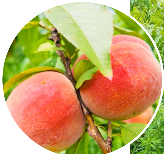
金黄泛红的果实掩映在绿叶间。