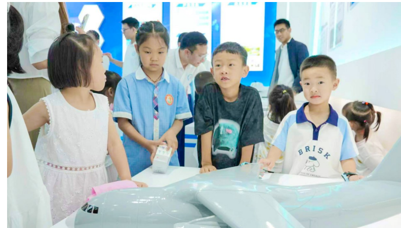
孩子们对展出的无人机模型表现出浓厚兴趣。