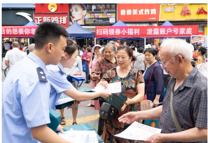
工作人员开展反诈宣传。

跨区域金融风险联防联控是“遂潼一体化”协同治理的重要内容。此次联动创新采用“联合宣传、协同共治、风险共防”模式，全方位织密遂潼金融安全防护网。潼南区政府办公室相关负责人表示，潼南区与遂宁市将持续深化协作，常态化开展金融风险联合排查、联合宣传、联合处置，加快构建一体化金融风险防控体系，全力防范化解跨区域金融风险，持续优化两地金融生态环境，切实守护好群众“钱袋子”。