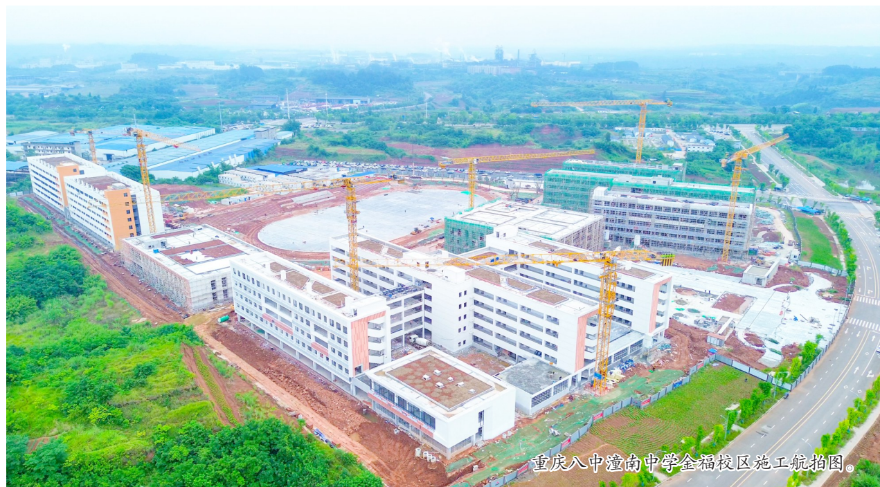
重庆八中潼南中学金福校区施工航拍图。

走进项目建设现场，塔吊林立、机器轰鸣，建设者们正抢抓施工黄金期，在各作业面上紧张有序地忙碌着。在教学楼内，工人们正分散在不同教室，有条不紊地进行墙地砖铺贴、涂料粉刷及门窗安装；放眼整个校区，综合管网铺设、道路硬化与绿化种植交叉作业，多台挖掘机与工人们默契配合，现场繁忙而有序。截至目前，校园运动场的基层处理已全面完成，即将