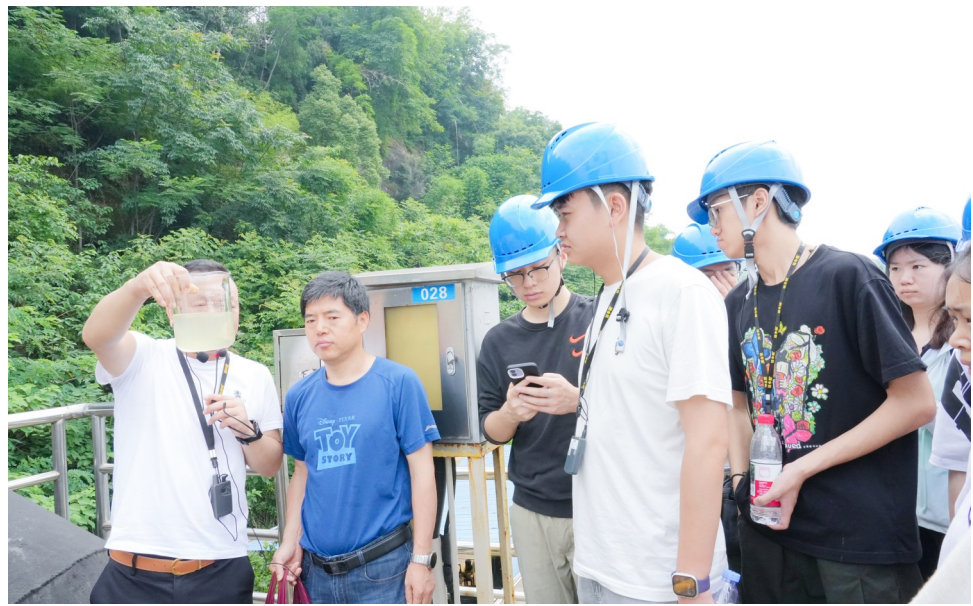
师生们实地参观污水处理关键环节。

本报讯(记者 陈俊霖 何云飞)生活污水汇入管网后，究竟要经历怎样的“洗礼”，才能褪去污浊、重归澄澈？近日，区生态环境局开展环保设施向公众开放活动，邀请西南大学70余名师生走进潼南高新区北区、东区污水处理厂。在这场沉浸式的实地研学中，青年学子们探寻城市水环境治理的奥秘，让书本里的环保理论在治水一线落地生根。