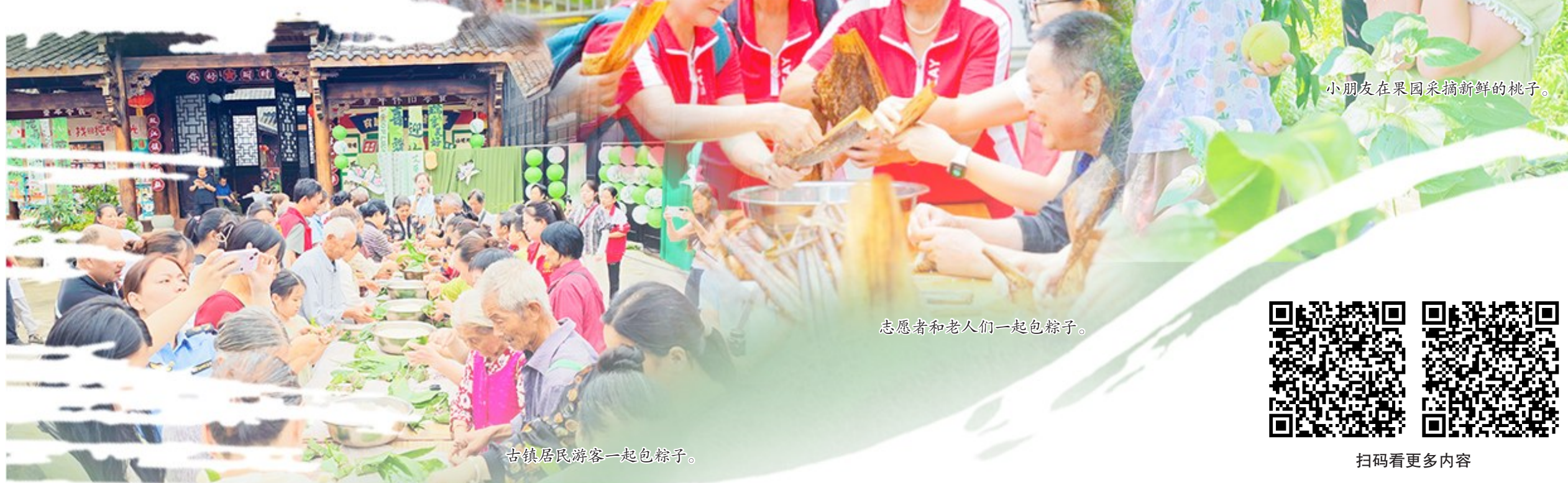
小朋友在果园采摘新鲜的桃子。