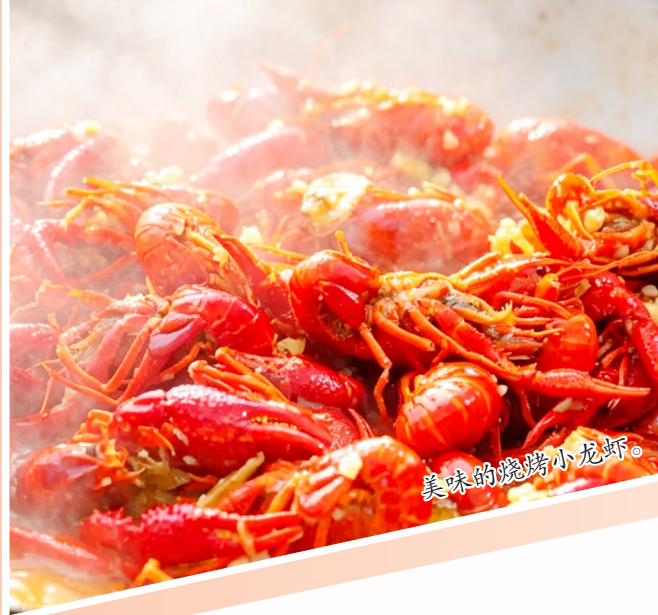
美味的烧烤小龙虾。