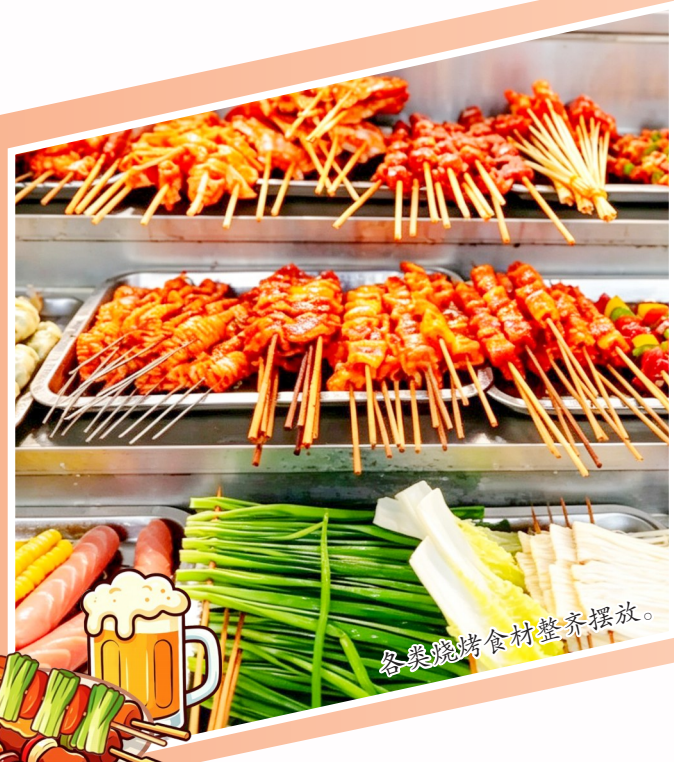
各类烧烤食材整齐摆放。

表演，氛围感十足。除特色非遗展演外，主办方还轮番推出趣味互动文娱环节，调动全场参与热情。“苍茫的天涯是我的爱，绵绵的青山脚下花正开。大家猜一猜，这是哪首歌的歌词？”主持人话音未落，台下游客便齐声应答《最炫民族风》，现场听歌识曲互动瞬间引燃夏夜。从国民金曲《奢香夫人》到国风热歌《山河图》，一首首耳熟能详的旋律奏响，游客踊跃举手抢答，答对者可兑换主办方专属礼品和烧烤代金券。江畔欢呼声、喝彩声此起彼伏，氛围持续升温。