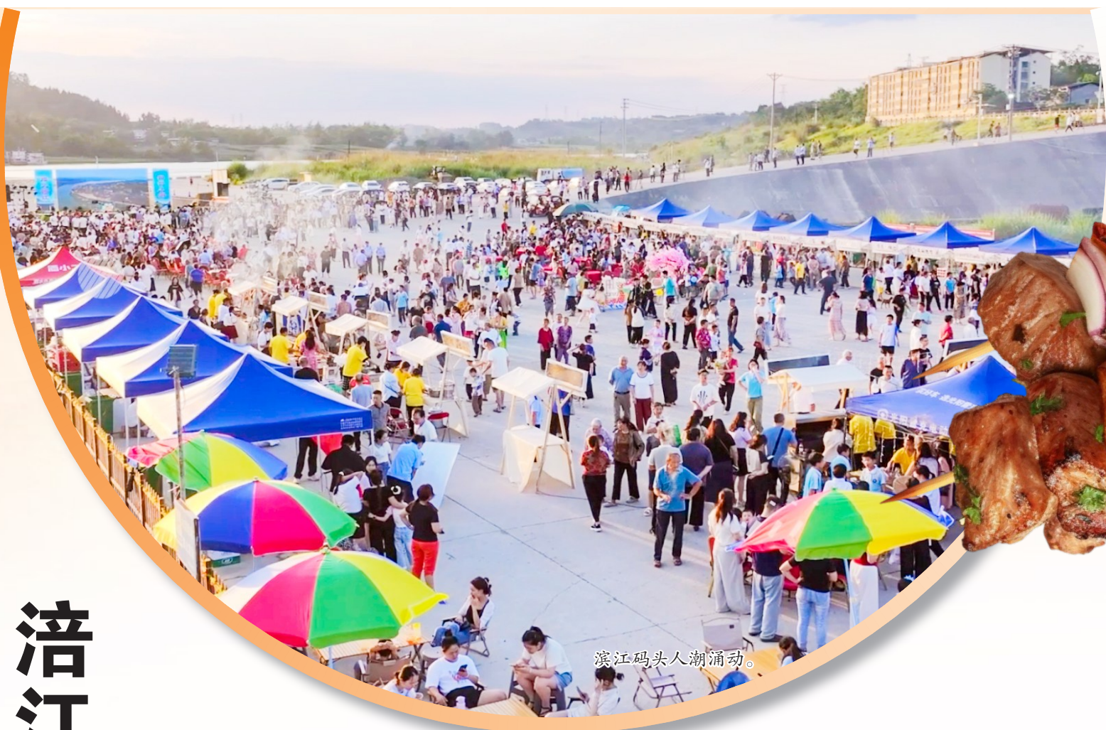
滨江码头人潮涌动。