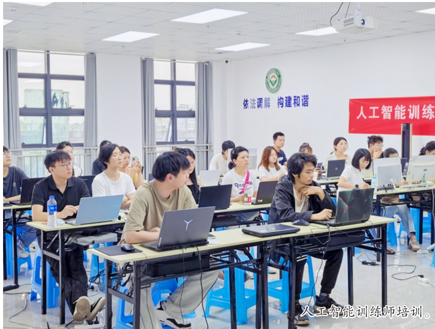
人工智能训练师培训。