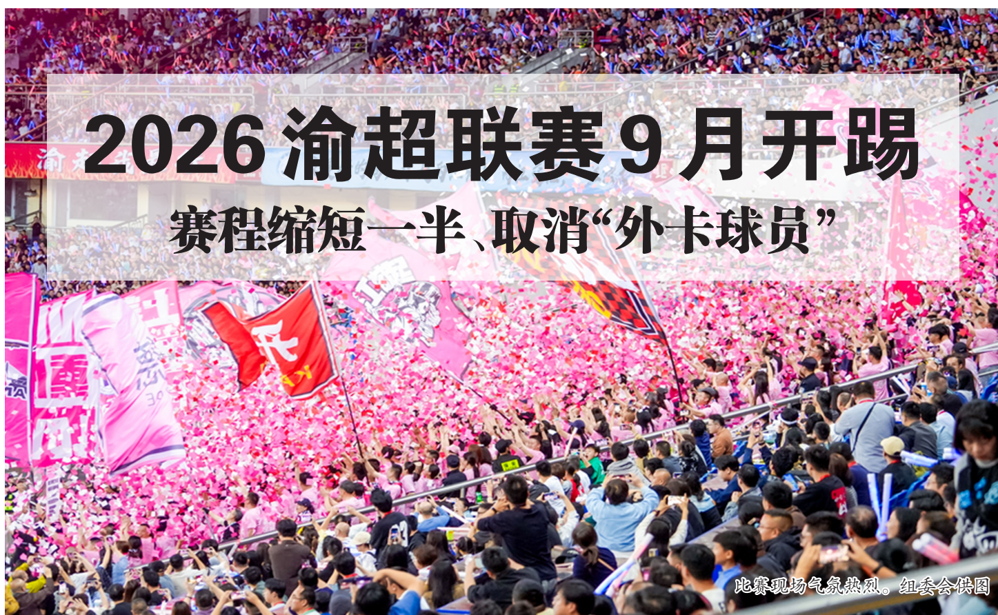
比赛现场气氛热烈。

各位球迷小伙伴们,注意啦!2026渝超联赛定于2026年9月至2027年1月举办。