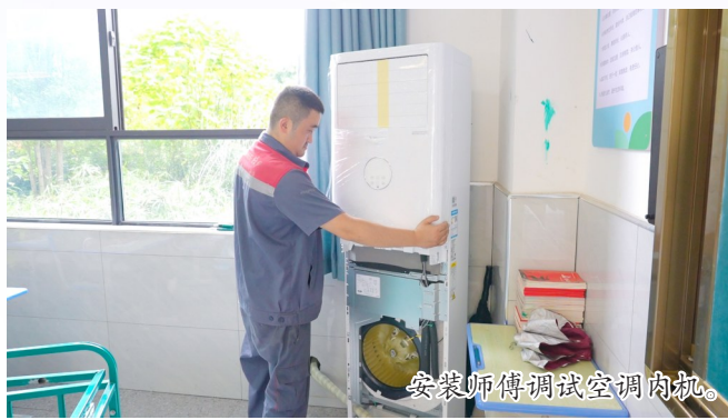
安装师傅调试空调内机。

本次“清凉”工程惠及全区52所中小学，规划加装空调3587套，新增变压器26台，将覆盖普通教室、特色功能室、学生食堂、宿舍等全部校园场景。目前青石小学、东安小学、潼州小学、琼江小学4所学校率先启动空调安装，卸货、打孔、挂机、调试各项工序有序推进。