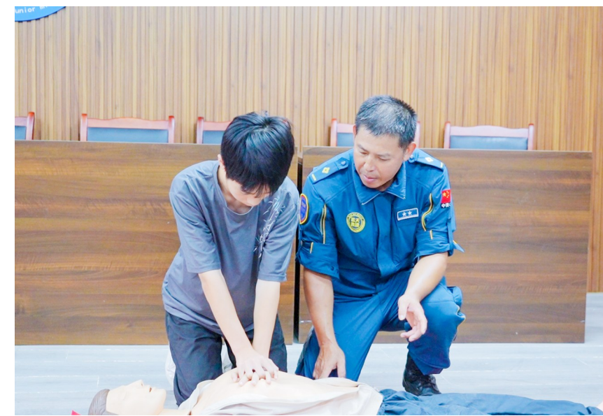
同学们现场实操心肺复苏技能。

论学习+实操演练”模式，融合警示教育、思政宣讲、互动问答、实战演练多重环节。活动中，宣讲员结合青少年溺水典型警示案例，细致讲解野外水域潜藏风险，逐条科普防溺水“六不准”、落水自救与科学施救核心要点，并开展安全知识抢答，以互动问答巩固宣讲内容。实操环节由蓝天救援队现场示范落水自救、岸上借力救援实操及心肺复苏等技巧，手把手指导学生、家长识别河塘沟渠等野外水域隐患，熟练掌握