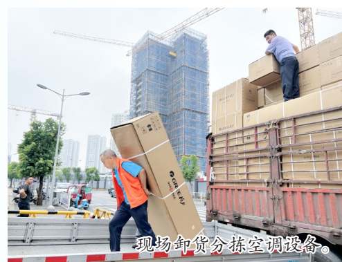
现场卸货分拣空调设备。

学生的期盼正是工程推进的动力。为确保项目如期高质量交付，区教委严把工期、质量、安全三道关口，科学排布施工计划，分片分区压茬推进；统一设备采购与施工标准，实行完工逐台核验制度；规范作业流程，常态化开展安全巡检。同