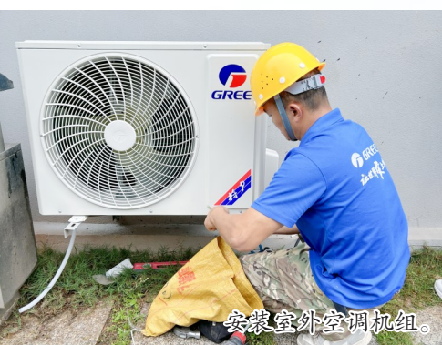
安装室外空调机组。

时，针对暑期高温、汛期多雨等可能影响施工进度的因素，提前制定应急预案，确保工程建设不停步、不断档。