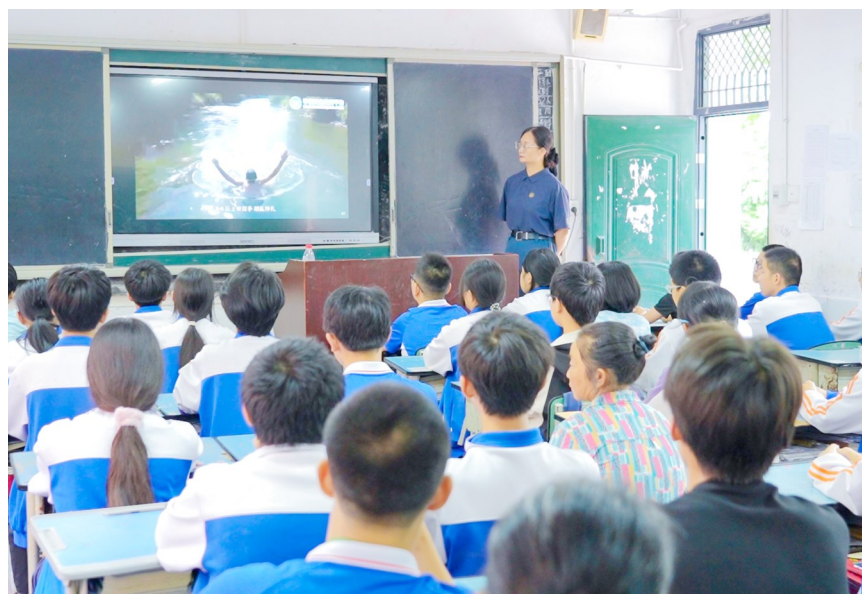
蓝天救援队给同学们讲解安全知识。

本报讯（记者 陈俊霖 丁怡然）“看似平静的池塘暗藏淤泥暗流，遇到同伴落水切勿盲目下水，学会科学呼救才是保护自己和他人的关键。”近日，上和镇在上和中学开展党的创新理论精微传播工程微宣讲活动，围绕“珍爱生命 严防溺水”安全教育宣讲，宣讲员、蓝天救援队队员、在校学生及家长代表共同参与。 夏季高温来临，青少年溺水事故进入高发期。本次活动采用“理