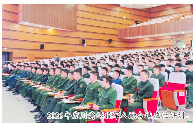
2026年度川渝退役军人融合适应性培训。

退役军人是党和国家的宝贵财富，退役军人工作关乎军心民心、强军大局，直接影响军政军民团结和基层平安稳定。近年来，潼南区退役军人事务局紧扣“让军人成为全社会尊崇的职业、让退役军人成为全社会尊重的人”核心目标，坚持党建引领、服务为本、双拥聚力，聚焦思想引领、就业安置、优抚双拥三大主业，深耕特色服务品牌、创新便民服务模式、办好涉军民生实事，以实干实绩交出了一份有温度、有力度、有深度的退役军人工作答卷。