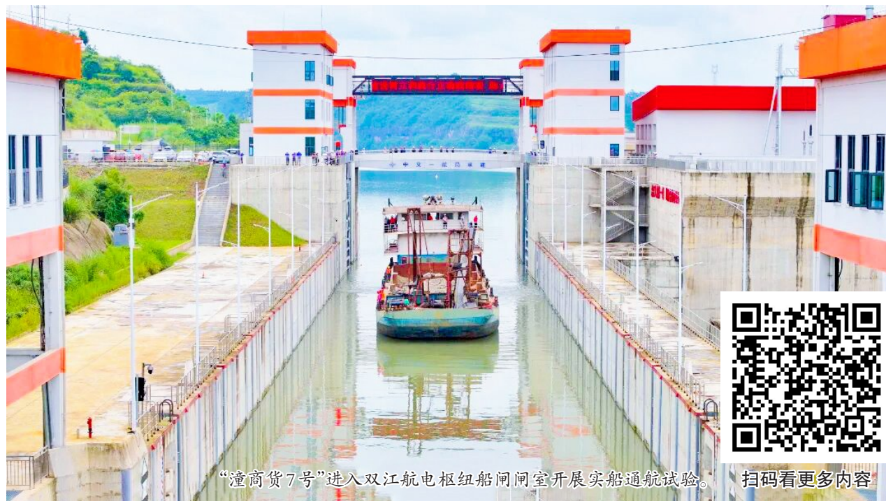
“潼商货7号”进入双江航电枢纽船闸闸室开展实船通航试验。

“作为涪江入渝第一哨，双江航电枢纽将发挥它的桥头堡作用，与涪江沿线其他枢纽协同联动，共