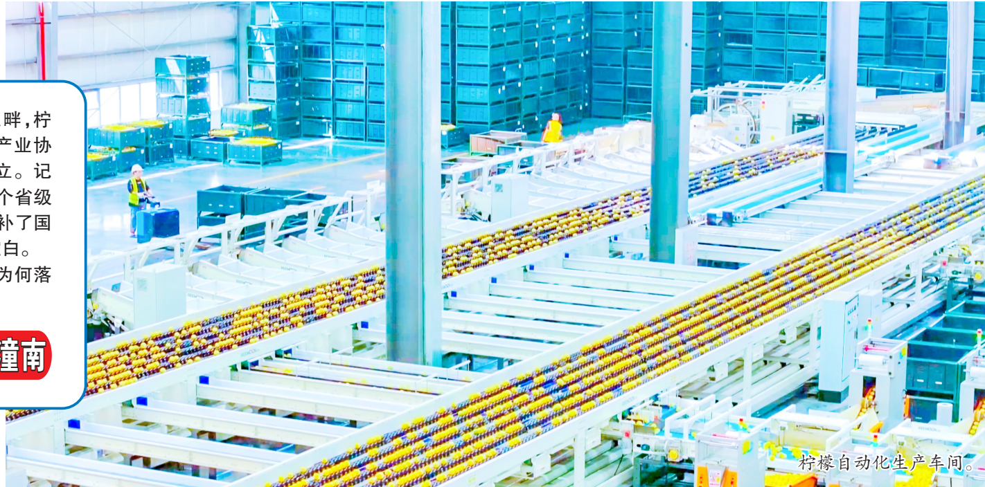
柠檬自动化生产车间。

会议要求，要全力推进巡查问题闭环整改，建立清单台账、限期销号，举一反三开展危化、交通、建筑、消防、火灾等领域拉网式排查。紧盯化工厂区、商超学校、在建工地等重点场所，严管有限空间、动火等高风险作业，精准化解安全隐患。抓实汛期监测预警、避险转移、应急演练等防灾举措，分级管控人员密集场所消防风险。全区上下要坚守“万无一失”标准、常怀“一失万无”警醒，扛牢安全责任、抓实整改落实，持续稳固安全生产和防灾减灾大局，为现代化新潼南高质量发展筑牢安全屏障。