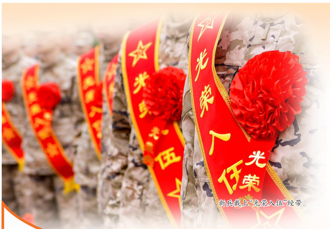
新兵戴上“光荣入伍”绶带。

退役军人是党和国家的宝贵财富，退役军人工作关乎军心民心、强军大局，直接影响军政军民团结和基层平安稳定。近年来，潼南区退役军人事务局紧扣“让军人成为全社会尊崇的职业、让退役军人成为全社会尊重的人”核心目标，坚持党建引领、服务为本、双拥聚力，聚焦思想引领、就业安置、优抚双拥三大主业，深耕特色服务品牌、创新便民服务模式、办好涉军民生实事，以实干实绩交出了一份有温度、有力度、有深度的退役军人工作答卷。