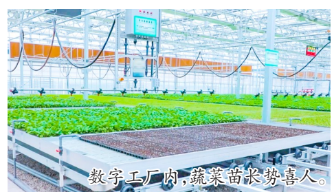
数字工厂内，蔬菜苗长势喜人。

组建市级柠檬产业协会，既是推动行业抱团发展、转型提质的务实举措，也是重庆柠檬产业迈向规范化、标准化、品牌化、国际化的全新起点。