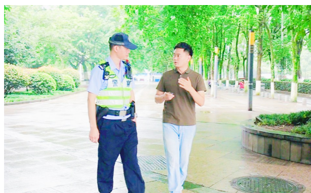
记者向执勤交警了解智能红绿灯车流动态配时工作情况。

本报讯(记者 沈金桥 通讯员 李宇轩)近日,针对梓潼街道办事处门前路口红绿灯配时问题,不少市民在重庆潼南客户端留言反映,该处信号灯存在红时长偏长、绿灯通行时间较短的现象。尤其在早晚高峰时段,车辆通行缓慢,常需等候两至三个信号周期方能通过,行人过街亦需较长时间等待。部分市民因不了解信号灯调控机制,误以为信号灯时长固定,对通行体验提出疑问。